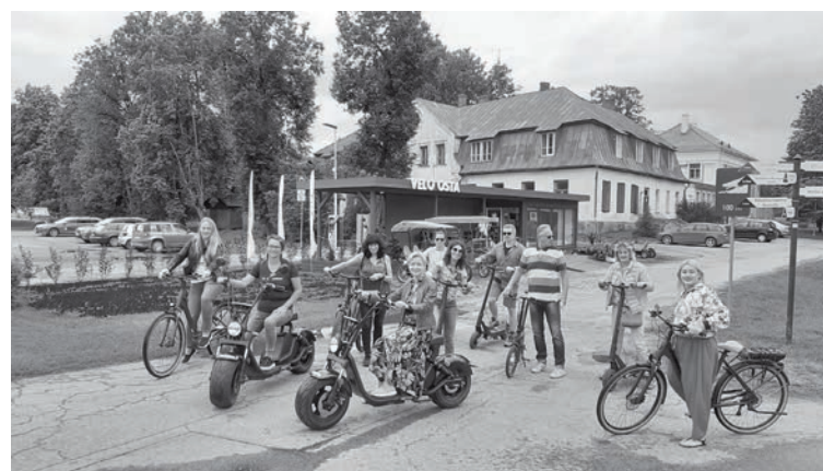
Latvijas tūroperatoru uzņemšana Alūksnē

Investīcijas aizsargājamo ainavu apvidū "Veclaicene", nacionālais novērtējums kā EDEN labākajam labjūtes galamērķim, teritorijas iekļaušana garās distances pārrobežu pārgājienu maršrutā "Mežtaka" un Covid-19 ierobežojumi, veicinājis dabas tūristu pieaugumu šajā teritorijā. Dabas māju pieprasījums pieaudzis ne tikai vasarā, bet arī ziemas mēnešos, kopā pārsniedzot 400 rezervētās nakts. Viesu novērtēti ir arī pašapkalpošanās tūrisma punkti Kornetos (2020. gadā 6875 apmeklētāji) un uz A2 šosejas (2020. gadā – 1876 apmeklētāji). Tas vēlreiz apliecina aizsargājamo ainavu apvidus potenciālu tūrisma piesaistei