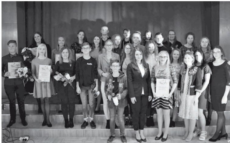
Alūksnes novada iedvesmojošie jaunieši

Par aktīvu iesaisti Ernsta Glika Alūksnes Valsts ģimnāzijas un