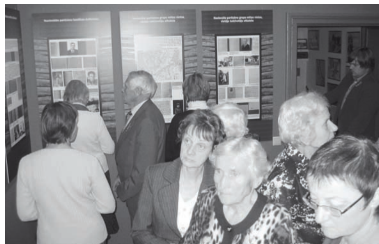
Jaunatklāto ekspozīciju ar interesi apskatīja apmeklētāji

"Rally Alūksne" tiek organizēts sadarbībā ar Latvijas Automobiļu federāciju un Alūksnes novada pašvaldību. Biļetes uz pasākumu varēs iegādāties no 1. decembra. "Rally Alūksne 2019" ietvaros notiks arī sacensības starp vēsturiskajām automašīnām un rallijsprintā. Plašāka informācija par sacīkstēm sekos jau drīzumā.