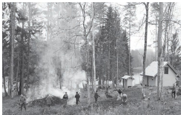
Talka pie Palpiera ezera