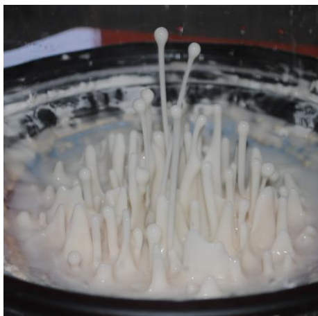
“Šķidrā skaņa”. Apmeklētāji var regulēt skaņas frekvenci un stiprumu, lai redzēt kādu iespaidu tās atstāj uz šķidrumu.

Z(in)oo piedāvās interaktīvas ekspozīcijas lai apmeklētāji varētu paši izmēģināt dažādas tehnoloģijas un pārbaudīt dabas likumus: mācīties matemātiku lēkājot, izbaudīt gravitāciju šūpolēs, izprast berzi, braucot ar speciāli aprīkotiem kartingiem, redzēt skaņu, veidot zobratu pārnesumus, saprast katapultas darbības principus, būvēt un vadīt robotus, redzēt zibeni, kustināt priekšmetus ar domu spēku. Kopā Z(in)oo piedāvā vairāk par 30 dažādām ekspozīcijām. Lūk dažas no tām: