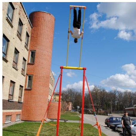
“Kosmiskās šūpoles”. Paši drosmīgākie apmeklētāji var pārbaudīt savu spēku un iemaņas, veicot pilnu apli speciāli izgatavotās šūpolēs.

Plašāka ekspozīciju galerija apskatāma Z(in)oo mājas lapā: www.zinoo.lv