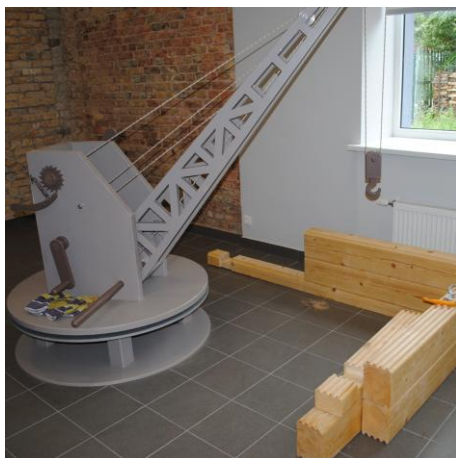
“Celtnis”. Apmeklētāji, pa vienam vai komandā, var izprast celtna darbības principus un sacensties, kurš ātrāk uzbūvēs māju.