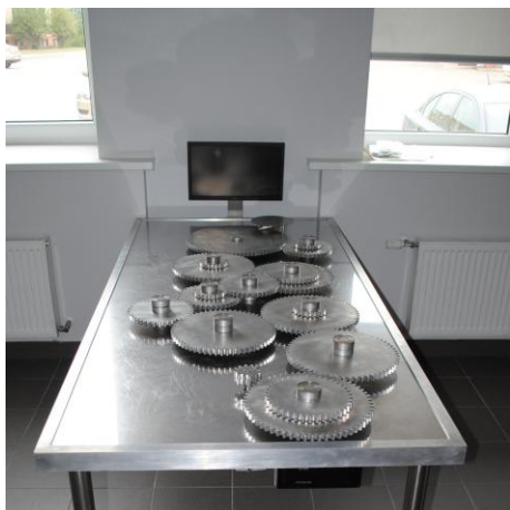
“Zobratu galds”. Apmeklētājam ir iespēja pārvietot un savienot dažādus zobratu, lai iegūtu pēc iespējas lielāku griezes momentu.