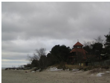
Ragaciems pie Baltijas jūras / Lāsma Ģibiete / Rīga, Engures novads

No Rīgas reģiona uz doto brīdi saņemtas kopumā 15 leģendas. Savukārt visvairāk pieteikumu vai atsauksmju saņemtas par šādiem trīs objektiem: Ragaciems, Zinātņu akadēmijas skatu laukums un Lībiešu upuralas pie Svētupes.