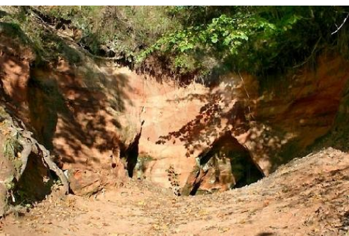
Lībiešu upuralas pie Svētupes / Iveta Ozola - Ozoliņa / Rīga, Salacgrīvas novads

Brīnišķīgs skats paveras uz visām debess pusēm. Pietiekami platā platforma un pamatīgais drošības valnis ļauj justies droši pat 17. stāvā. Leģendāra šī vieta izrādās ar to, ka pirms „Staļina dzimšanas dienas tortes” būvniecības tajā vietā atradās kapi, un vēlāk arī krievu bazārs koka ēku veidā, kas bijis izcils arhitektūras paraugs 19. gadsimta pirmajā pusē.”