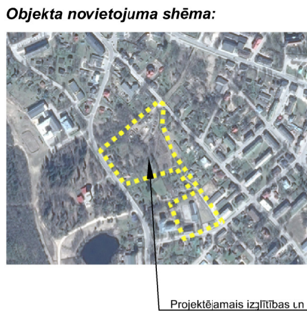
Projektājamais izglītības un sporta centrs