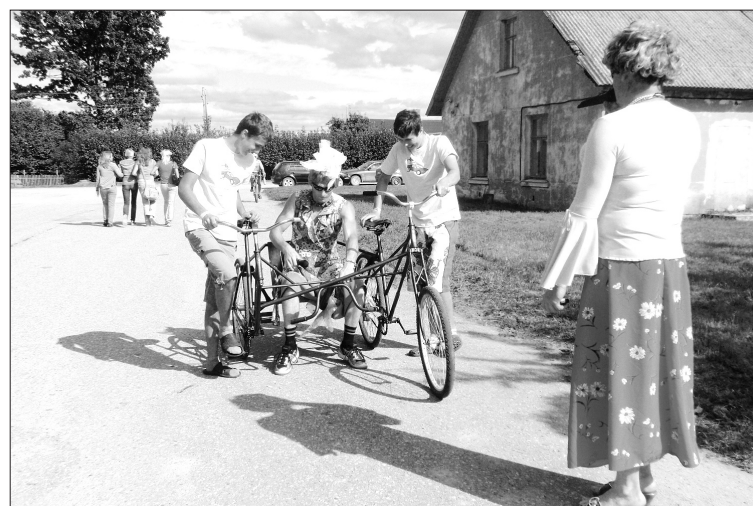
Ieskats iepriekšējā gada Malienas pagasta svētku norisēs

Lai arī aicināti 7. augustā uz Malienas pagasta svētkiem!