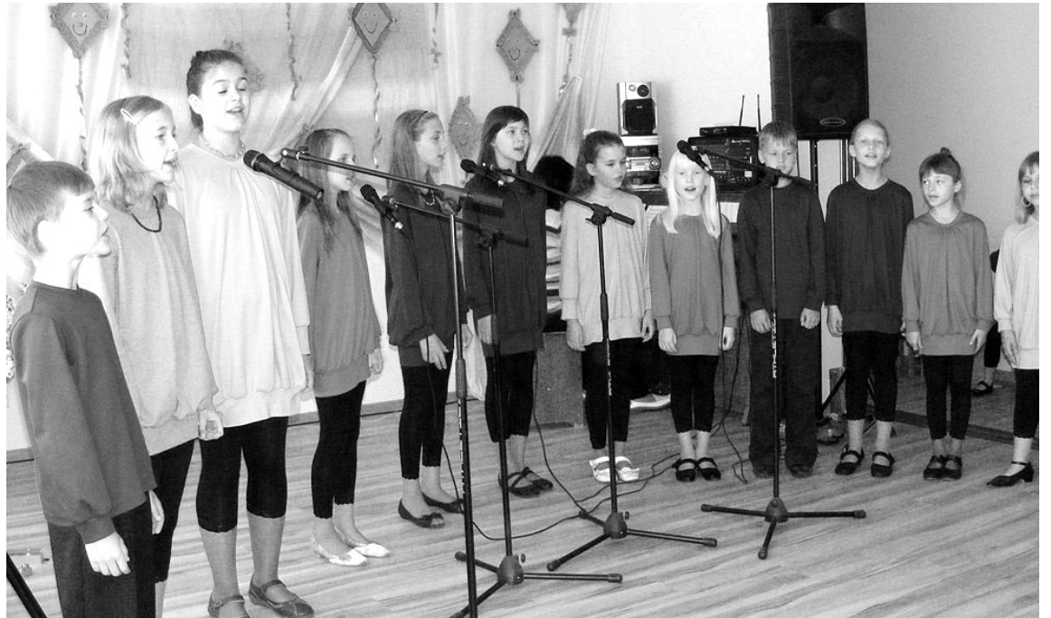
Pirmsskolas izglītības iestādes „Sprīdītis” izremontētajā zālē koncertu sniedz Alūksnes Bērnu un jauniešu centra vokālais ansamblis „Puķzirņi”

Iepirkuma rezultātā plānotajās projekta būvniecības izmaksas radās ekonomija, tādēļ pašvaldība lūdza Valsts reģionālās attīstības aģentūrai saskaņot izmaiņas projektā, papildus iekļaujot abu izglītības iestāžu virtuvju remontu un tehnoloģisko iekārtu modernizēšanu, kā arī teritorijas labiekārto-