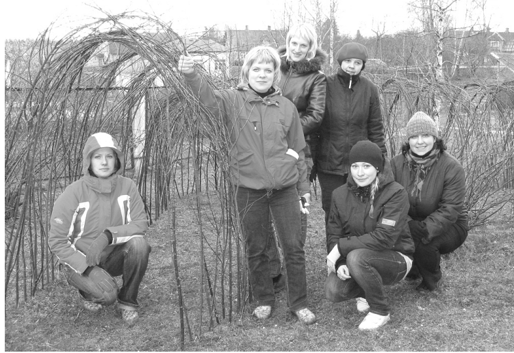
Iestādes padomes pārstāvji pie jaunā kārklu tuneļa

Arī šogad izzinām vecāku idejas un ieteikumus. Maijā anketējām vecākus, kuru bērni šogad uzsākuši savas gaitas „Sprīdītī” un tos vecākus, kuru bērni pārcelti uz citu grupiņu. Iestādes kolektīvs tiek iepazīstināts ar anketu rezultātiem, ieteikumi tiek apspriesti un ņemti vērā. Tā, piemēram, šogad pēc iestādes padomes ierosinājuma katras grupas skolotājas organizēja individuālās sarunas ar vecākiem, lai izsmeltoši iepazīstinātu vecākus