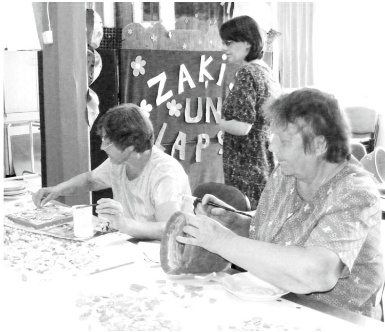
Radošajās darbnīcās var apgūt dažādas noderīgas prasmes un iemaņas