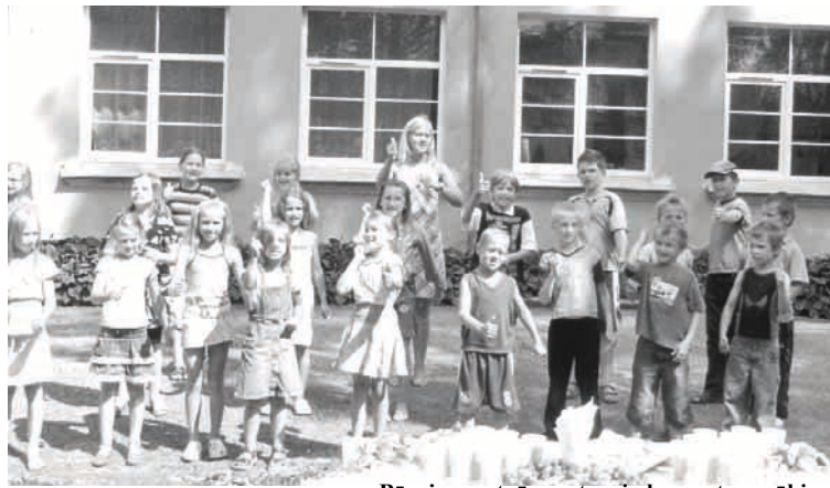
Bērni nometnē sagatavoja koncertu vecākiem