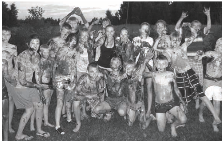
Nometne „Mēs, malēnieši, Malēnijā” notika jau ceturto reizi

Ļoti jauki nometnes dalībniekus uzņēma gan Lizuma muižā, gan Vecgulbenes muižā, gan arī Bānīša depo. Visi nometnes dalībnieki kaut reizi dzīvē ir braukuši ar Mazbānīti, bet Bānīša mājās - depo daudzi bija pirmo reizi. Ar interesi bērni klausījās gan stāstījumā, gan vizinājās ar drežīnu.