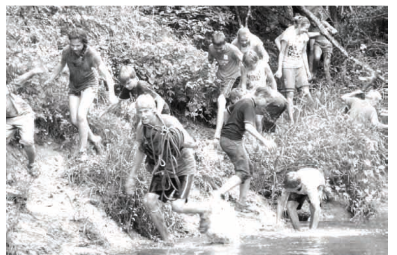
Dalībniekus gaidīja dažādi piedzīvojumi

Par to, ka aktīvais tūrisms ir interesants, pārliecinājāmies arī šķēršļu saliedēšanas takā komandām. Lai to veiktu, bija nepieciešama ne tikai