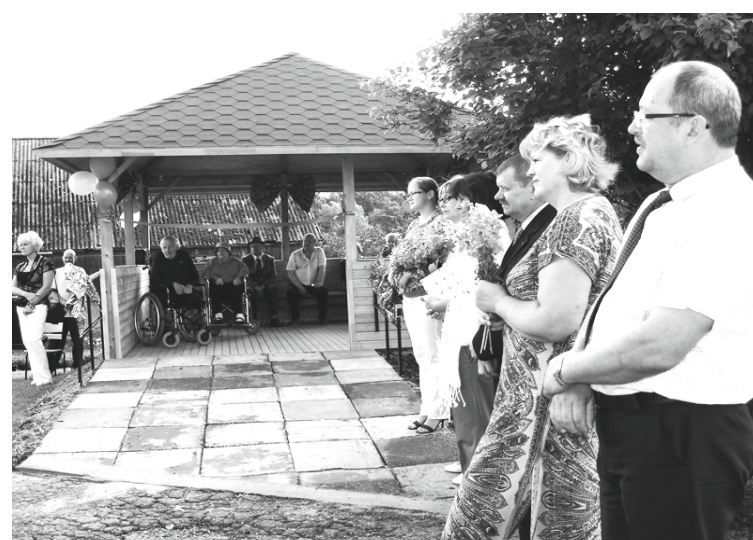
Projektu noslēguma pasākumā piedalījās gan VAS „Hipotēku un zemes banka”, gan Alūksnes un Apes novada fonda, kā arī Alūksnes novada pašvaldības pārstāvji

Visi realizētie projekti sniedz arī vizuālu uzlabojumu, jo sociālās aprūpes centra ēka ir vēsturiska un tā atrodas pa ceļam uz tādām iecienītiem tūrisma objektiem kā Tempļakalns, Saules tilts, arī Alūksnes kapsētu. Līdz ar to arī pilsētas viesi dodoties tos apskatīt, redzēs sakārtotu sociālās aprūpes centra teritoriju.