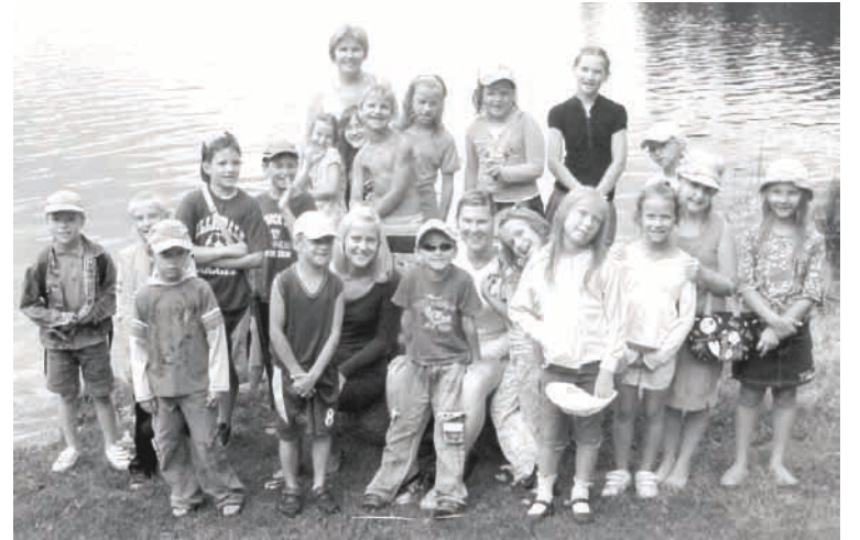
Nometne bērniem bija interesanti pavadīts laiks