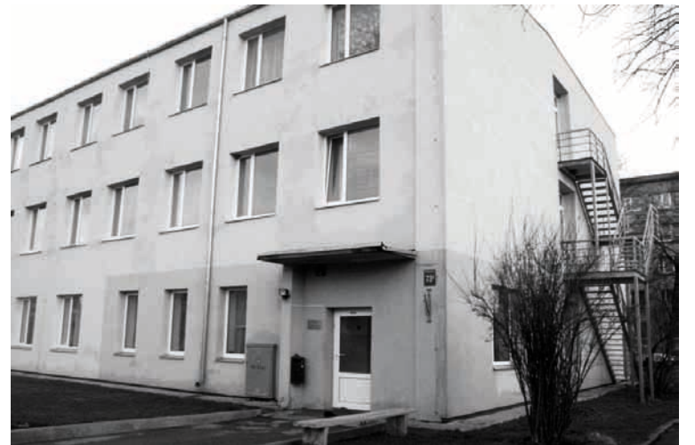
Savukārt Balvu novada Sociālā dienesta ēka, kurā atrodas arī naktspatversme, jau ir sakārtota un tās apkārtē nekas neliecina, ka šeit atrodas patversme

Saskaņā ar normatīvajiem aktiem, naktspatversme klientam nodrošina vakariņas un brokastis, iespēju pārņemt ziemas periodā no pulksten 18.00 līdz 8.00, vasaras periodā no pulksten 20.00 līdz 7.00. Savukārt,