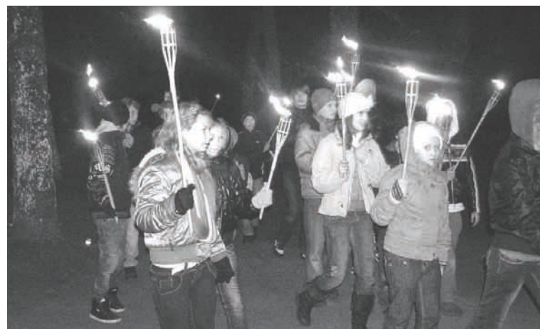
11. novembrī skolēni, skolotāji un Mārupes pagasta ļaudis devās lāpu gājienā

Sekoja uzdevums, kurā bija jāatpazīst kultūrvēsturiskie pieminēklī un jāatbild uz jautājumiem par tiem. Pārsvār tie bija mūsu pagasta un novada ievērojamākie pieminēklī. Skolēniem bija jādemonstrē savas zināšanas, atpazīstot vēsturiskās personības,