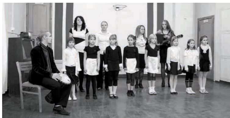
Dzied Bejas pamatskolas ansamblis

Vizuālās mākslas konkursā „PET PUDELES PĀRVĒRTĪBAS” pieda-