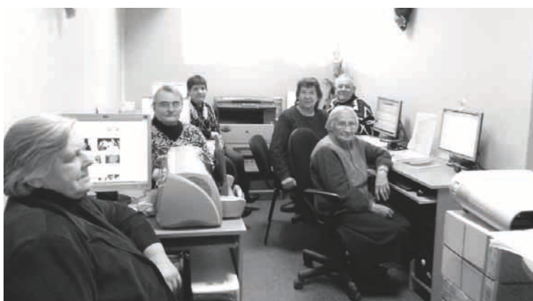
Alsviķos seniori apgūst datorprasmes

Zināšanas iegūstam pēc portāla bibliotēka.lv e - kursa „Kā strādāt ar datoru un internetu”. Sākumā apgūvām arī pēc e - kursa „Mans draugs dators”, kas paredzēts bērnu apmācībai, bet noder arī pieaugušajiem. Skatāmies apmācību programmu un kopīgi veicam visas darbības soli pa soli. Šie e - kursi ir ļoti veiksmīgi, tie ir atbilstoši visiem – ir tikai mazliet jābūt pacietīgam un viss sanāk. To gan nevar iemācīties