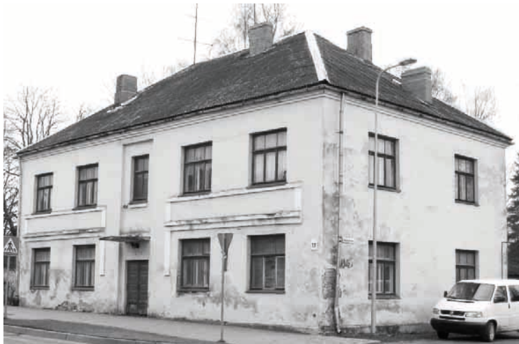
Alūksnē ēka, kurā ierīkos naktspatversmi, šobrīd ir sliktā stāvoklī gan no iekšienes, gan ārienes un pašvaldība vēlas to sakārtot pievilcīgu