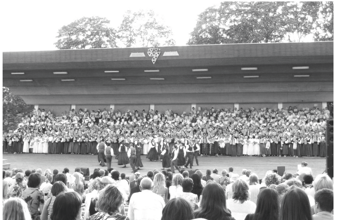
Deja un dziesma ir vienotas – Dziesmu dienā savu deju programmu Jaunlaicenes folkloras kopas „Putnis” pavadījumā rādīja Alsviķu deju kolektīva „Jandāls”