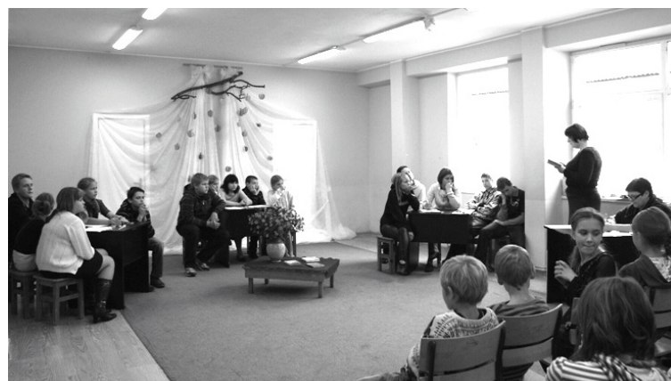
Notiek viktorīna par novadnieci Māru Svīri

Pēc ļoti vienlīdzīgas cīņas 1. vietu ieguva 9. klase, saņemot dāvanā dāvanu karti no „Zvaigzne ABC” grāmatnīcas 12 latu vērtībā, 2. vieta 7. - 8. klasei un dāvanu karti 10 latu vērtībā, 3. vieta 5. - 6. klasei un dāvanu karti 8 latu vērtībā. Visas klases saņēma arī saldumus.