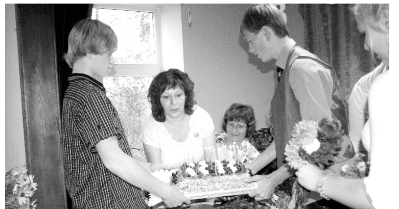
Devītklasnieku pašceptā torte ar svecītēm skolotājiem bija lielākais pārsteigums

Viedokļi ir dažādi, bet svarīgākais taču šai dienā bija godināt skolotājus. Paldies mūsu pedagogiem un arī devītklasniekiem par īpašāk organizēto mācību procesu!