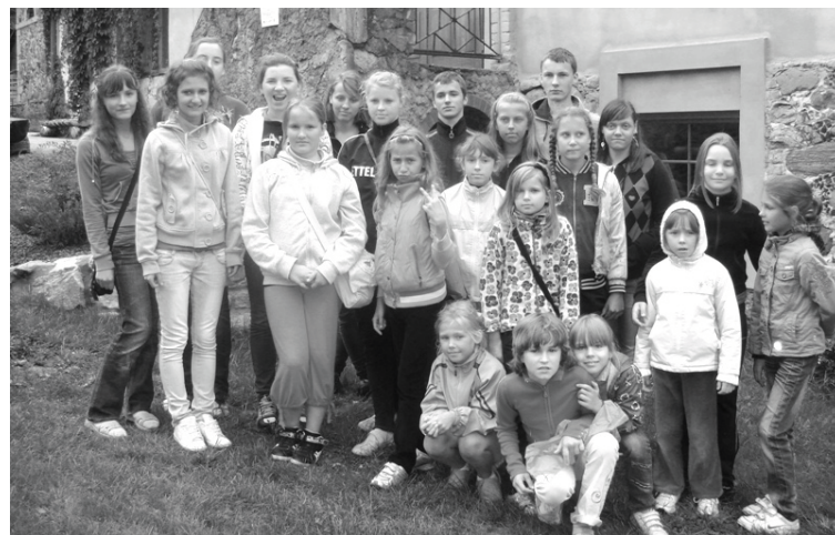
„Bērnu žūrijas” dalībnieki, viesojoties Jaunlaicēnē