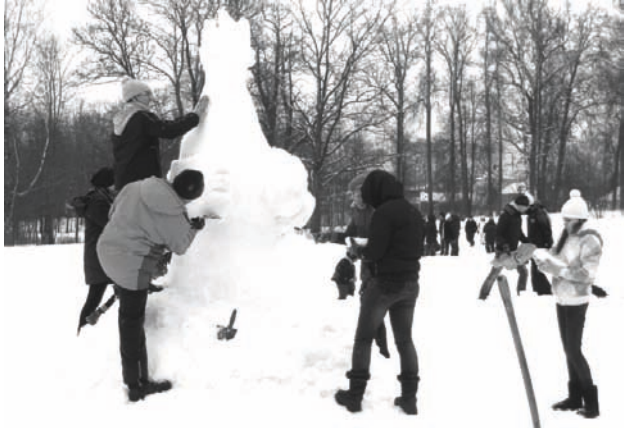
Sniega skulptūru konkursā skolu un klašu grupā viskuplāk pārstāvētā bija Alūksnes novada vidusskola, bet uzvarēja Alūksnes Mākslas skolas komanda (attēlā)