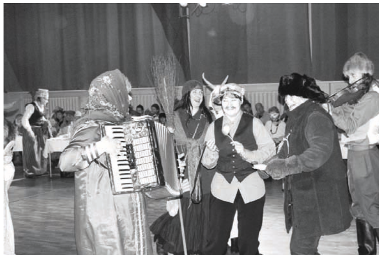
„Putnis” Salacgrīvas masku tradīciju festivālā

Vakarā Salacgrīvas kultūras namā notika masku izrādīšanās. Katrs kolektīvs ar 10 minūšu programmu izklaidēja skatītājus un žūriju. Maskas bija ļoti daudzveidīgas un interesantas. Uzvedumu oriģinalitāte saistīja ikvienu apmeklētāju, jo gandrīz visas kopas savos uzvedumos iesaistīja skatītājus. Katrā ziņā mājās atbraucām ar jaunu pieredzi un iespaidiem.