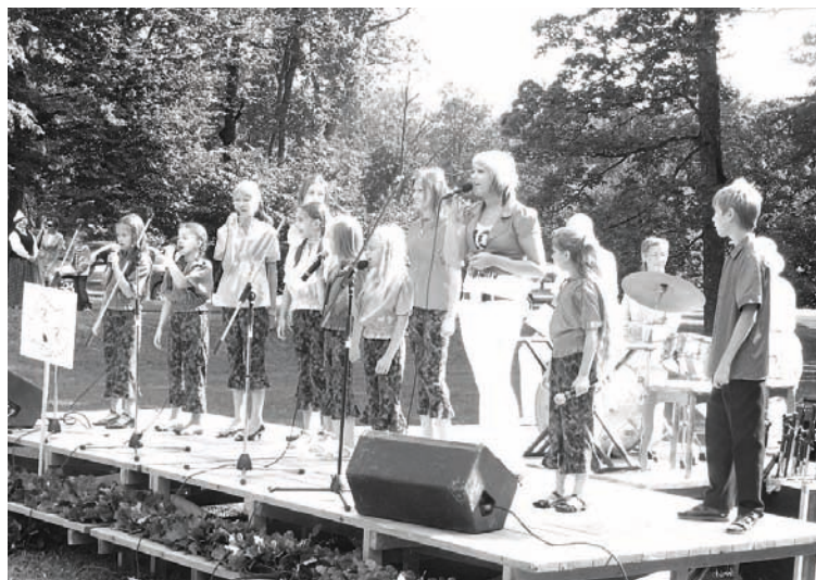
„Mārupīte” dzied Alūksnes pilsētas svētkos 2009. gadā

Radošā sadarbībā ar NVO „Saulstariņi”, kurā darbojas bērni ar īpašām vajadzībām, uzrakstīts dziesmu cikls par māti. Pēc bērnu