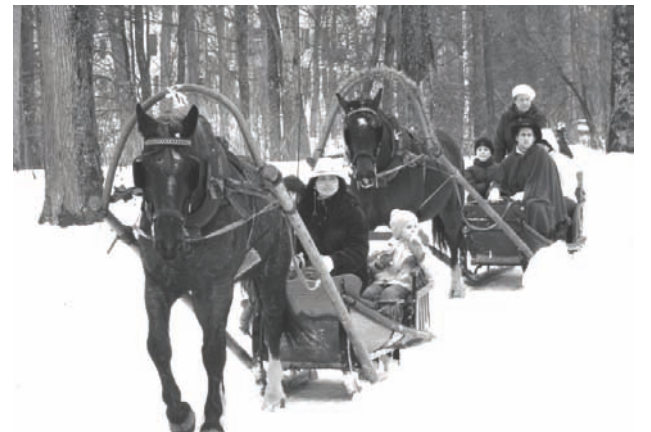
Vizināšanās zirga pajūgā bija iecienīta izklaide svētku apmeklētājiem