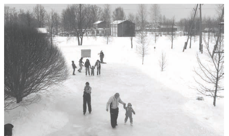
Pie “Dailēm” tapusi slidotava ilzeniešiem

23. februāra vakarā norisinājās 3. atklātais zolītes turnīrs, kas vienmēr pulcē dalībniekus arī no tālākām vietām un ciņa izvēršas nopietna un interesanta. 24. februārī aktīvākā sabiedrības daļa - pašdarbnieki, sportisti, mednieki un makšķernieki pulcējās uz atpūtas vakaru „...tepat pie mums”. Kopīgi mājīgā gaisotnē pārrunājām dažādus notikumus katra kolektīva un visa pagasta dzīvē, veidojām kopīgu improvizēto teātra uzvedumu,