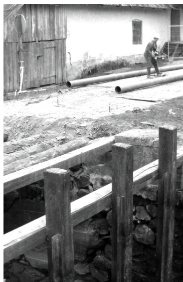
Projekta ietvaros Ates dzirnavu tilts Kalncempjos nu jau ir atjaunots