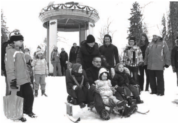
Netradicionālo sniega braucamrīku konkursā atsaucība bija neliela, taču komanda „Lejnieki un vedekla” bija īpaši padomājuši un arī nobraucieni izdevās lieliski