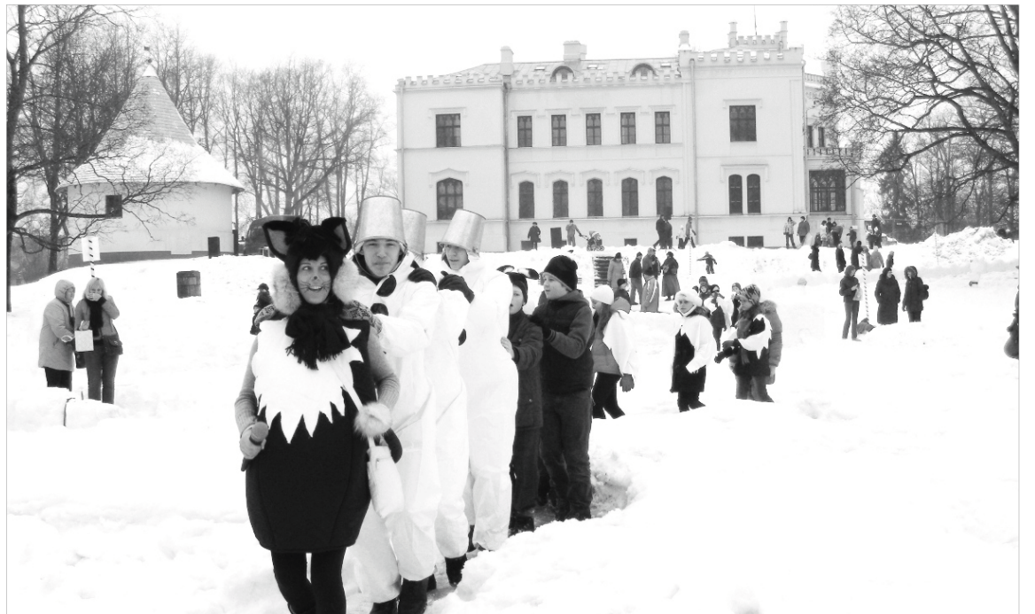
Viena no mazo alūksniešu iecienītākajām vietām Alūksnes Muižas parka svētku laikā, protams, bija sniega pilsēta, kuras tapšanā pirmssvētku nedēļā iesaistījās gan Kājnieku skolas karavīri, gan svētku rīkotāju darba grupa, gan arī brīvprātīgie palīgi – paldies viņiem!

Projekta laikā arī tika materiāli dalībai trīs starptautiskās tūrisma izstādēs - buklets un pastkarte par Alūksnes Jaunās pils kompleksu un muižas parku. Arī Alūksnes novada dalība šajās izstādēs tika finansēta