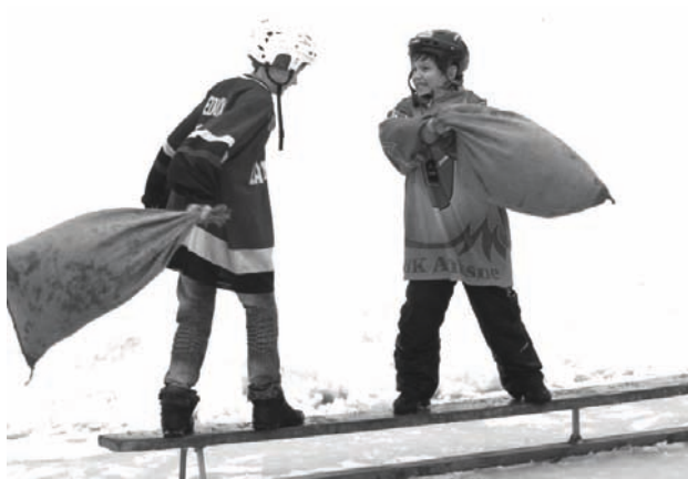
Bruņinieku cīņās nereti uzvarēja draudzība