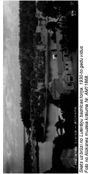
Skats uz būvniecības teritoriju, izstrādātais mets. 1930. gada pagā, rindas.