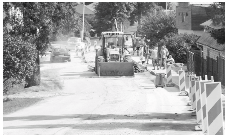
Miera ielā šonedēļ notiek projekta laikā skarto ielas posmu sagatavošana asfaltēšanai un asfalta seguma atjaunošana.