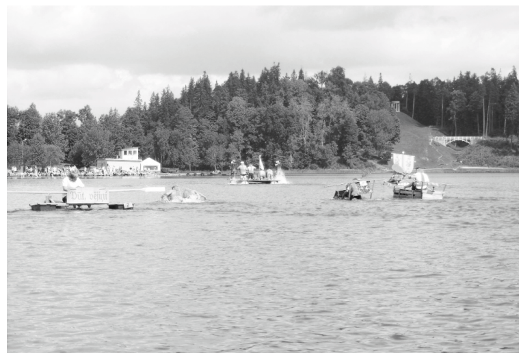
„Alūksnes pļosts” ir jauka pilsētas svētku tradīcija, tādēļ aicinām tajā piedalīties gan jau iepriekšējo gadu, gan jaunus dalībniekus

Pēcpusdienā savus priekšnesumus rādīs senioru deju kolektīvs „Atbalss” no Daugavpils, kā arī Alūksnes pilsētas Tautas nama deju kolektīvs „Jukums”. „Jukums” šajos svētkos demonstrēs daļu no