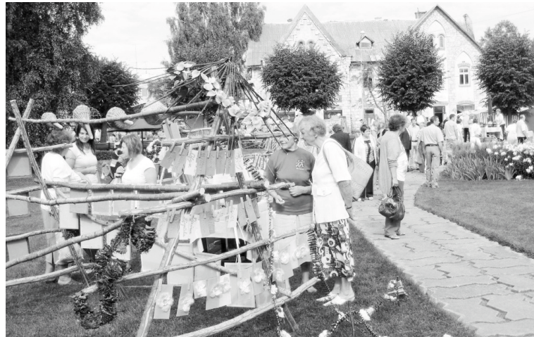
Amatnieku tirdziņš šogad notiks skvērā Lielā Ezera ielā. Tirdziņam aicinām pieteikties Alūksnes pilsētas Tautas namā