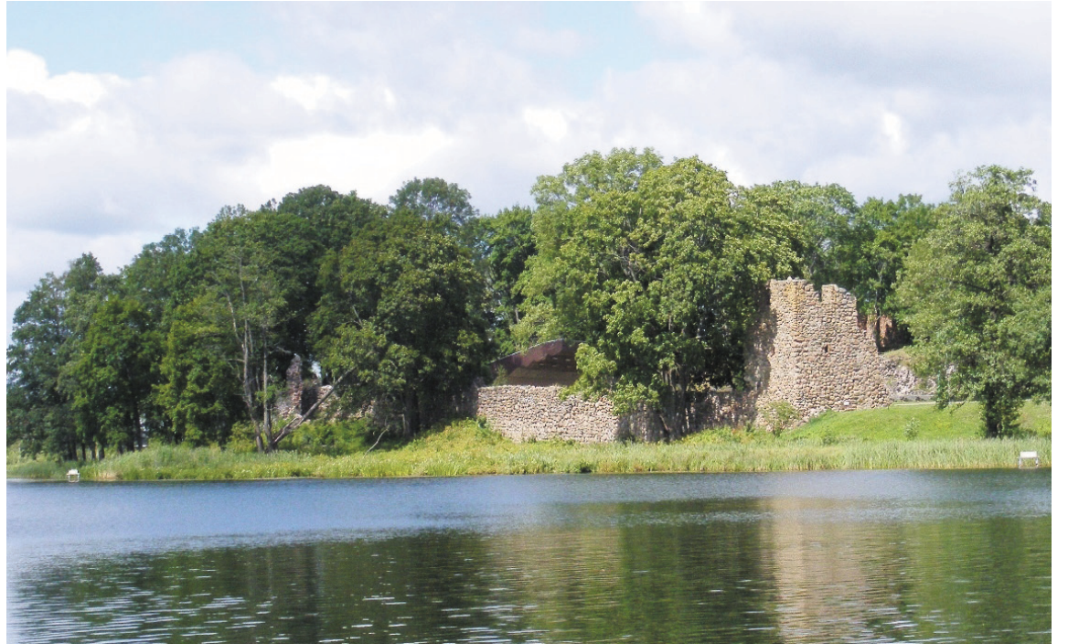
Alūksnes pilsētas svētkos svinēsīm 670. gadskārtu Marienburgas cietoksnim Pilssalā

- Esam lūguši būvniekiem sakārtot darbu norises vietas līdz pilsētas svētkiem. Līdzīgi aicinām arī ikvie-