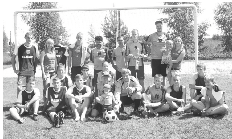
Lai gan par ceļojošo kausu sacentās tikai divas komandas, spēle ritēja spraigi