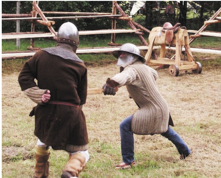
Viduslaiku cīņas rādīs Geidānmuižas pārstāvi, aicinot iesaistīties arī svētku dalībniekus