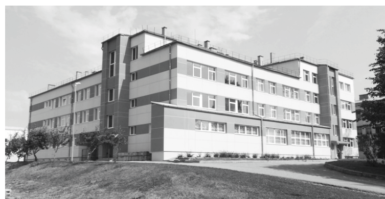
Ernsta Glika Alūksnes Valsts ģimnāzijas jaunais korpus kļuvis arī vizuāli pievilcīgāks.

Jāpiebilst, ka būvdarbi notika, ievērojot videi draudzīgas būvniecības organizācijas principus