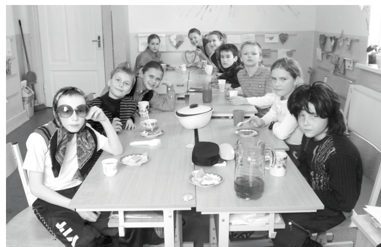
Bejas pamatskolēni radoši atzīmēja Meteņdienu

pasākums par godu mīlestības svētkiem. Sacentās klašu komandas: minūtes laikā bija jāpasaka pēc iespējas vairāk mīļvārdu, jāizveido Valentīndienas teiciens, jāattēlo neliels pasakas fragmentiņš un jāatzīstas mīlestībā kā pasaku varonim, kā kādas noteiktas profesijas pārstāvim vai kā