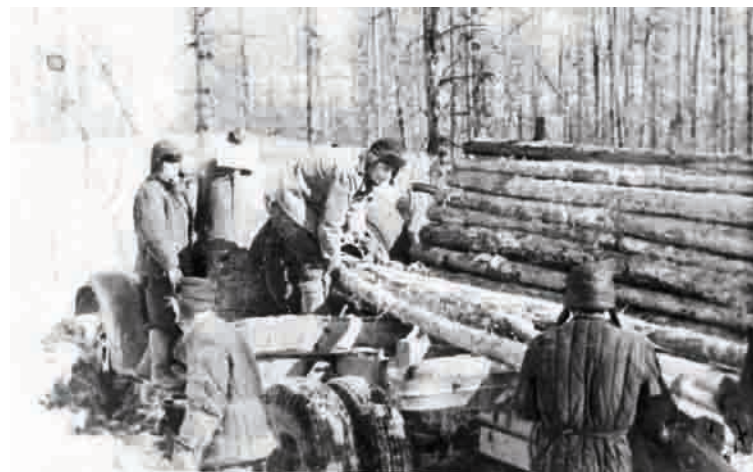
Latvieši meža darbos Kolimā, 1957. gads

Kopumā 1949. gada marta beigās caur Gulbenes dzelzceļa mezglu uz specnometinājuma vietām tika nosūtīti 8 ešeloni ar Latvijas iedzīvotājiem.