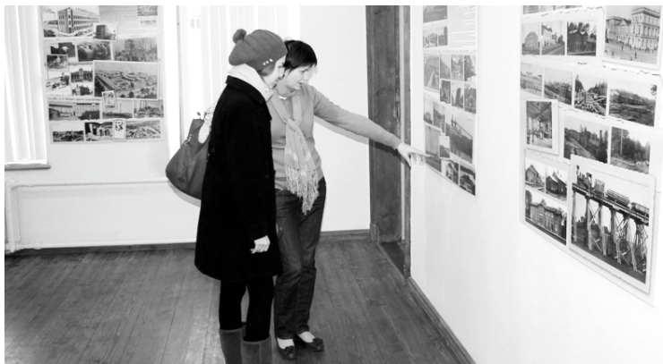
Alūksnes muzejā izstādi „Zudusī darbīgā Latvija” varēsiet aplūkot līdz 30. aprīlim