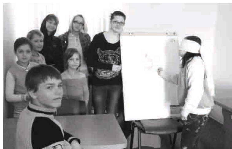
Māriņkalna sabiedriskajā centrā ir interesanti ikvienam