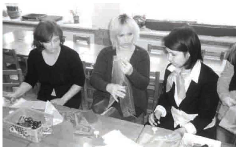
Radošajās darbnīcās apgūtas dažādas prasmes