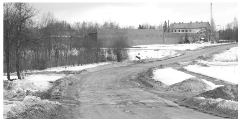
Rūpniecības ielas vidus posmu, par ko iedzīvotāji sūdzas visvairāk, sakārtosim primāri

Rūpniecības ielas pirmās kārtas būvniecības tāme ir 149 tūkstoši latu un tajā esam plānojuši atjaunot ielas brauktuves segumu, no jauna ierīkot ietvi, kas iepriekš tur nav bijusi, sakārtot lietus ūdens kanalizācijas sistēmu. Rekonstrukcijas plānā gan nav iekļauta ielu apgaismojuma ierīkošana, jo tas projektu ievērojami sadārdzinātu, taču ielai ir gana plaša zaļā zona, līdz ar to nākotnē ir iespēja domāt par apgaismojuma izveidi, nebojājot ielas segumu.