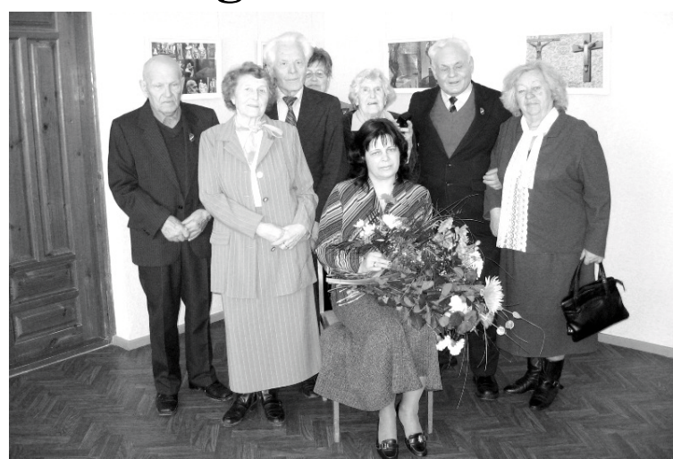
Skarbās atmiņas vieno tikšanās mirkļos

Pēc krimināllietas materiāliem 1946. gada 10. aprīlī (arī 26. aprīlī, 20. septembrī) padomju tiesas spriedums tika pasludināts 59 cilvēkiem, no kuriem 25 bija Viļakas jaunieši, 13 – balvieši, lielākā daļa no tiem bija skolotāji. Taču pārējās personas, kas arī tika aizturētas un tiesātas, bija vai nu pazīstamas ar