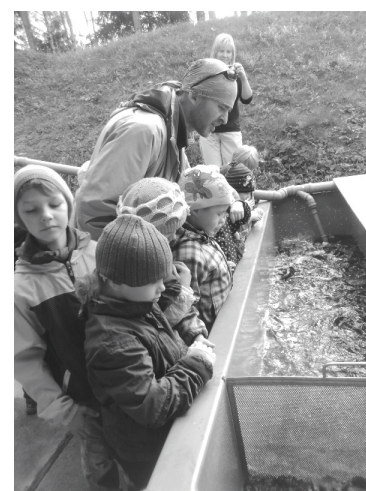
Iepazīstoties ar foreļu audzēšanu Silenieku dzirnavās

Bērniem bija jādarbojas deviņās pasaku pieturās un jākrāj punkti, lai uzzinātu, kurš no mums ir visveiklākais. Ieejot iekšā pa pasaku vārtiem, mums tika dots uzdevums būt vērtīgiem, veikliem, uzmanīgiem, lai varam tikt līdz pasaku ceļa galam, izejot visus pārbaudījumus, un uzvarēt. Katrā pieturā bērniem bija jāatmin, no kuras latviešu tautas