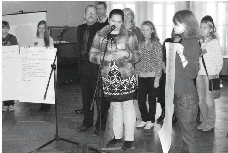
Pirmajā Alūksnes novada jauniešu forumā dalībnieki diskutēja par tādām tēmām kā „Jaunietis kā resurss”, „Jauniešu atgriešanās dzimtajā vietā un nodarbinātība”, „Informācijas pieejamība un jauniešu informētība” un „Drošība”

Alūksnes novada pirmais jauniešu forums notika 2009. gada decembrī, kad dalībnieki diskutēja par tādām tēmām kā „Jaunietis kā resurss”, „Jauniešu atgriešanās dzimtajā vietā un nodarbinātība”, „Informācijas pieejamība un jauniešu informētība” un „Drošība”. Katras grupas darba rezultātā tapa projekta/pasākuma plāns. Šo trīs gadu laikā pilnībā vai daļēji realizēti trīs no pasākumiem, piemēram, jau trīs gadus notikušas jauniešu līderu apmācības, izveidota