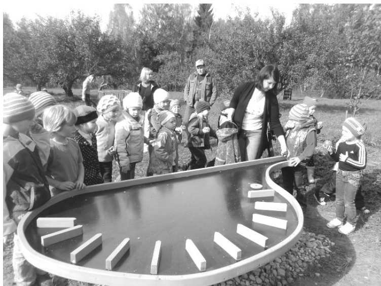
Mazie „pūcēni” Pededzes pasaku takā

Finansējumu, ko no valsts budžeta piešķir šīm iestādēm, nosaukuma maiņa neietekmēs.