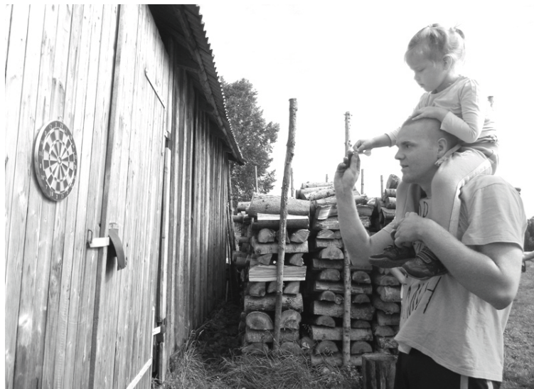
Izrādās, ka šautriņu mešanā var piedalīties arī divatā