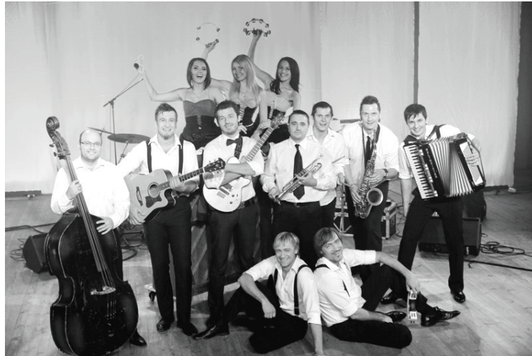
Biļetes var iegādāties Alūksnes pilsētas Tautas namā un „Biļešu paradīzē”