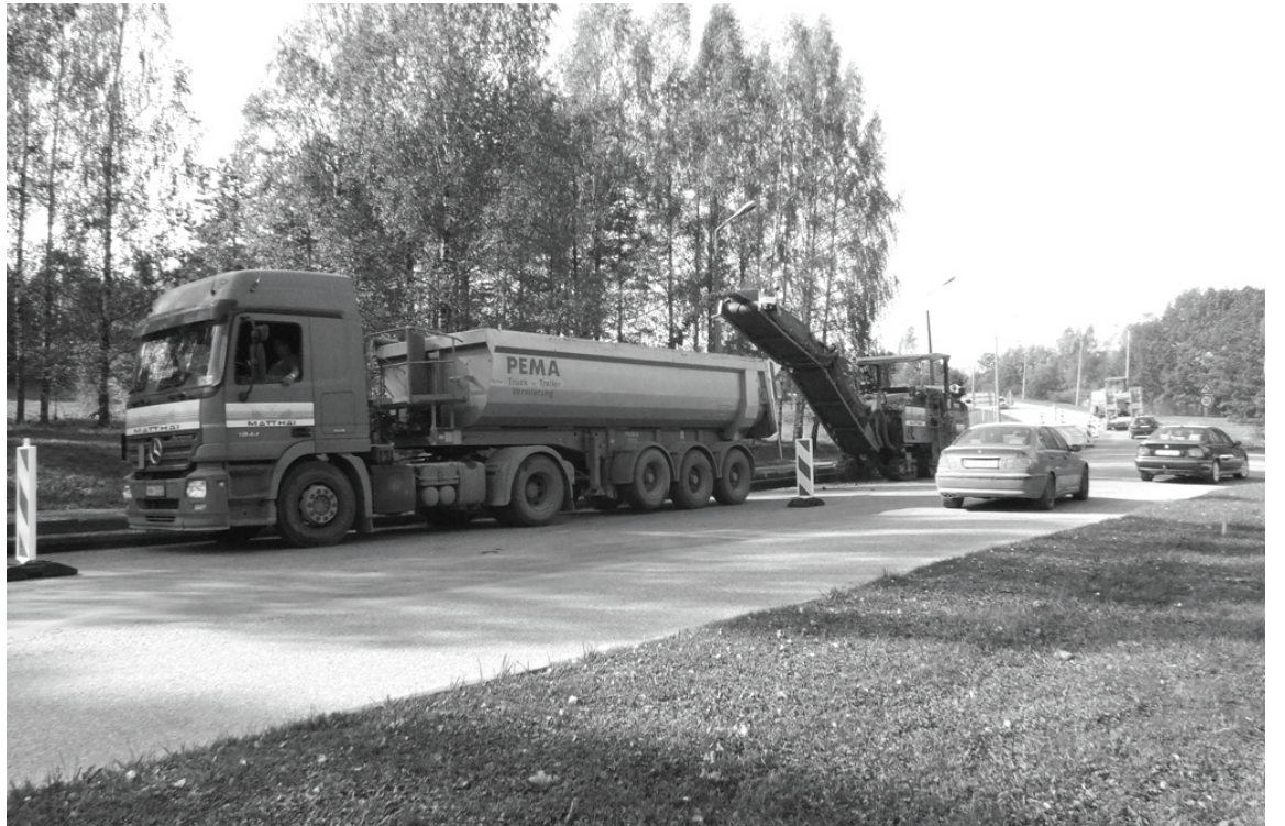
Pils ielas posmā līdz Augusta ielai demontēts ielas asfalta segums, ietve un apmales

No rekonstrukcijas darbu uzsākša- nas būvuzņēmējs ir veicis vecā ielu un ietves asfalta seguma un betona apmaļu demontāžu Pils ielas posmā no krustojuma ar Rīgas un Miera ie- lām līdz Augusta ielai. Miera un Pils ielu krustojumā demontē caurteku, kuru plānots rekonstruēt. Šobrīd tiek