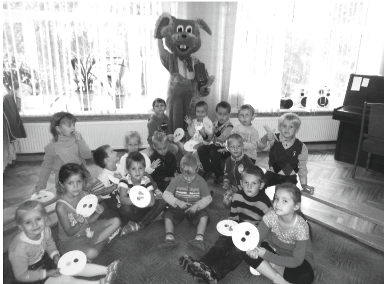
... gan arī atraktīvi kopā ar bērniem darbojas grupu telpās

Pasākums tika organizēts sadarbībā ar Jaunalūksnes pensionāru padomi, „Pūcītes” iestādes padomi, pulcinot audzēkņus, vecākus un citus interesentus.