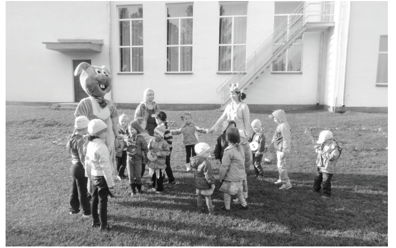
Zaķis gan izveda mazos pūcēnus rotaļās laukā...

Zinību dienas svinības iestādē tiek organizētas jau trešo gadu, padarot krāšņāku tuvāko apkārtni un priecējot bērnus. Šogad pasākuma tēma bija „Laimes poga”. Pogas nes laimi, palīdz atrast draugus, izrotā tērpu, ir saules un gaismas simbols. Zaķis ar laimes pogām kabatās pie pūcēniem viesojās jau 3. septembra rītā, kopīgi izrunājot visu par