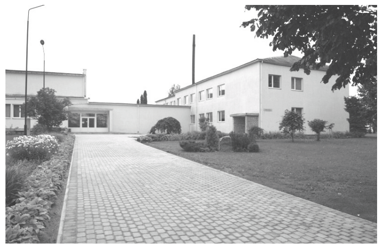
Jaunais bruģa segums ir Ziemera pagasta pārvaldes dāvina skolai

Darbus kvalitatīvi un īsā laikā paveica SIA „Alūksnes bruģakmens” darbinieki, un tagad teritorijas seguma nomaiņa dod iespēju ikdienā ērti pārvietoties, rada glītu vizuālo iespaidu, drošu un sakārtotu vidi, tā paplašina arī pasākumu sarīkošanas iespējas skolēniem. Tāpat būs nodrošināta veiksmīga kopšana ziemas laikā, kas līdz šim bija apgrūtināta, un ir paredzēta iespēja telpās iekļūt gan māmiņām ar ratiņiem, gan invalīdiem. Ir iegādāti arī jauni košumkrūmi, kas gaida uz mazpulcēnu čaklajām rokām.