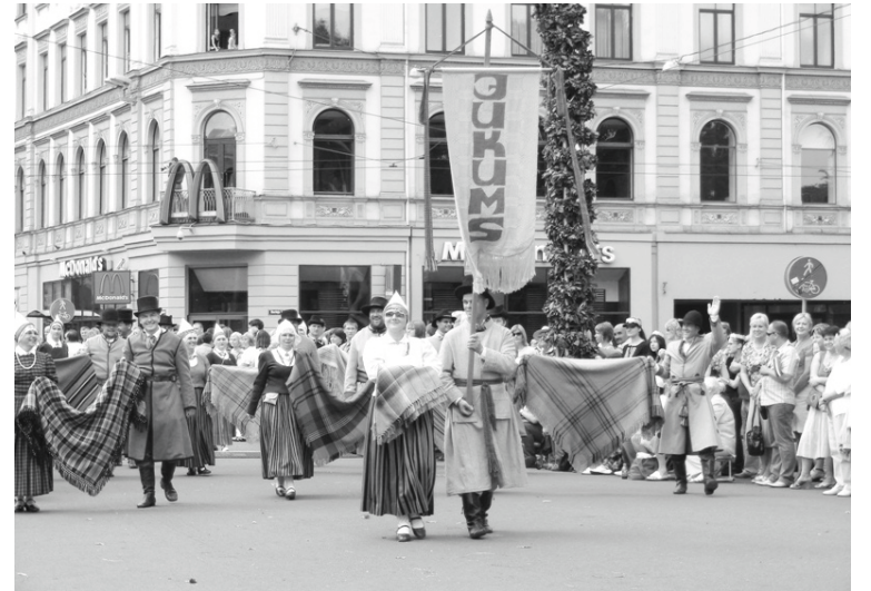
„Jukums” Dziesmu un deju svētku gājienā Rīgā

- Tas ir pozitīvo emociju vīruss, kas mūs tur kopā, jo bieži vien vaigu muskuļi sāp vairāk par kāju