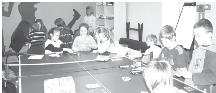
Bērni labprāt izmanto iespēju „Pa GALMĀ” spēlēt dažādas galda spēles

Tomēr kā jau minēts - jauns gads, jaunas iespējas! Jau pagājušajā gadā tika uzsākta tradīcija - ceturtdiena kā ABJC aktivitāšu diena un šogad tas viss turpinās jauniem spēkiem un idejām. Šogad jau notikusi picas cepšana kopā ar EBD brīvprātīgo