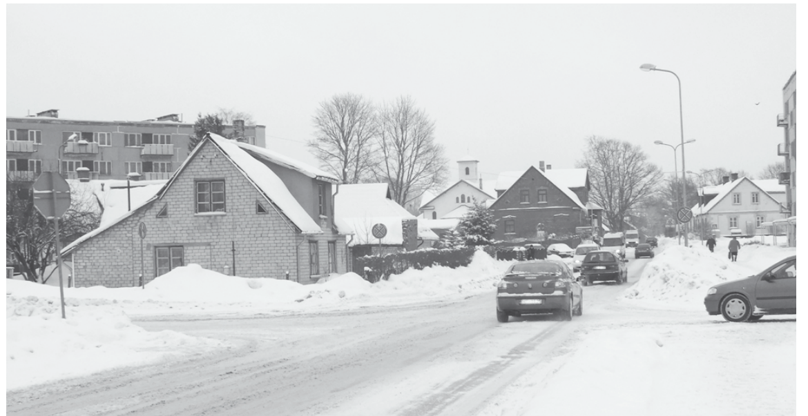
Projektu īstenojot, Helēnas un Bērzu ielu krustojumā uzlabos satiksmes drošību, izveidos apļveida krustojumu

Minētajā maršrutā notiks brauktuves seguma kapitālā rekonstrukcija, ievērojami uzlabojot tā nestspēju un ekspluatācijas īpašības. Rekonstruēs Helēnas un Bērzu ielas krustojumu, izveidojot rotācijas apli, kas ievērojami uzlabos satiksmes drošību un organizāciju līdz šim ļoti bīstamajā un sarežģītajā mezglā. Izveidotais aplis īpaši uzlabos gājēju satiksmes drošību, kā arī atvieglos kreisā pagrieziena veikšanu tranzīta maršruta mērķtiecīgajā virzienā. Rekonstruēs un izbūvēs gājēju ietves, īpaši pievēršot uzmanību gājēju infrastruktūras pielāgošanai personām ar īpašām vajadzībām. Tāpat projekta gaitā rekonstruēs ielu apgaismojuma sistēmu, izbūvēs lietus ūdens kanalizācijas sistēmu, nodrošinot