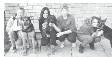
Brīvprātīgā darba ideja dzīvnieku mājā „Astēs un ūsās” jauniešiem šķiet interesanta

Noteikti īpašs ir mirklis, kad cilvēki nāk apskatīt kaķīti vai sunīti, un saka - „Mēs dosim iespēju viņam vai viņai dzīvot pie mums, mēs viņu lutināsim un mīlēsim!” pēc šiem vārdiem gan man acis ļoti mirdz, gan arī tam mīlulim, kuram būs jaunas mājas, actiņš ir prieks un arī nedaudz baiļu!”