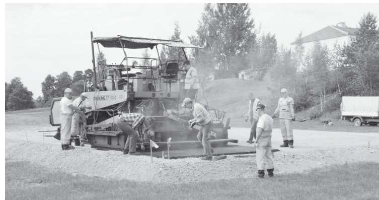
Ziemerī top strītbola laukums

Šī ir ieceres pirmā kārtā, bet nākamajā kārtā paredzēts laukumu labiekārtot un izveidot pludmales volejbola laukumu, vēlāk vingrošanas laukumu un citus aktīvās atpūtas laukumus, tā radot iespēju dažādu sporta veidu piekritējiem nodarboties ar sportu vienlaikus un vienkopus.