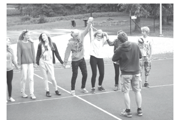
Nometnē „Vienā katlā” jaunieši apguva tādas ikdienai nepieciešamas prasmes kā saliedētība un sadarbība

Alūksnes Bērnu un jauniešu centrs jauniešu vasaras nometni noteikti rīkos arī nākamgad, tāpēc nenobīstieties un piedalieties arī Jūs!