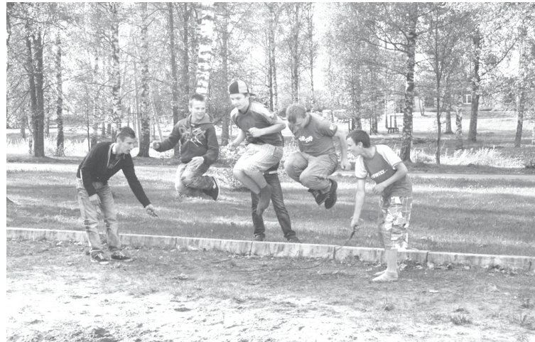
„Lēciens iespējās” ļāva jauniešiem apgūt jaunas prasmes un iemaņas

Sākot no februāra, notika iknedēļas jauniešu kluba „The OTHERS” otrdienu tikšanās ABJC telpās un tika veidots skrējiena scenārijs, gatavotas individuālā un grupu skrējiena aktivitātes, veidota starpkultūru pēcpusdienas, kuras laikā visus interesentus aicināja ielūkoties dažādu tautu atšķirīgajās Lieldienu tradīcijās, kuras tika prezentētas arī Liepņas internātpamatskolā un Pededzes pamatskolā. Notika arī dažādas radošās darbnīcas, kuru laikā jaunieši iepazīna filcēšanu, izveidojot zaķus, kas tika pasniegti „Zaķu skrējiena” īpašajiem dalībniekiem. Tika veidoti tērpi skrējiena organizatoriem, veidoti foto stūrīša atribūti un foto siena. Interesanta pieredze bija „Zaķu skrējiena” video reklāmas izveide, sākot ar scenārija plānošanu un noslēdzot ar video materiāla izveidi. Tika izveidota iesildīšanās aktivitāte skrējiena dalībniekiem, gatavoti priekšnesu-