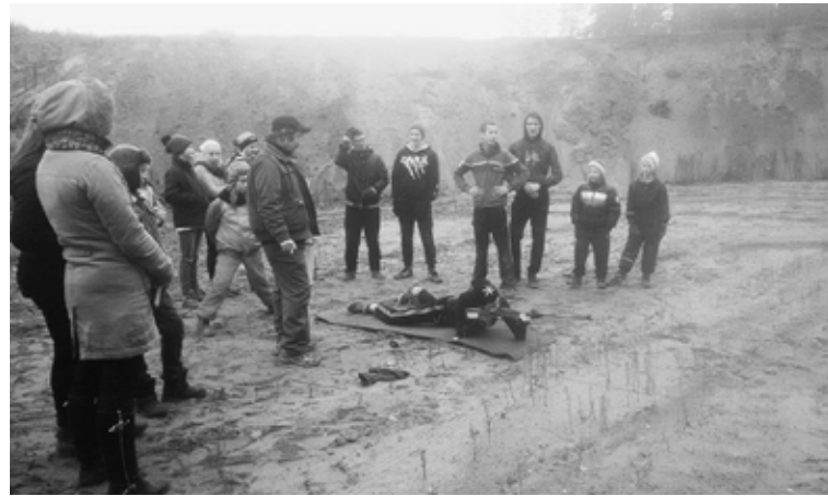
Māļupes pagasta “Mišķos” nu jau tradicionāli rudenos notiek jaunsargu sacensības

Visas komandas sacensībās uzrādīja labu sagatavotību un cīņas sparu. Tā 5. - 7. klašu grupā 3. vietu ieguva Strautiņi, 2. vietu Alūksnes pilsētas sākumskola, 1. vietu Māļupes pamatskola. 8. - 9. klašu grupā 3. vietu ieguva Malienas pamatskola, 2. vietu ģimnāzija, 1. vietu Māļupes pamatskola. Atbalstīt savas komandas bija sabraukuši arī līdzjutēji ar plakātiem. Spēļu starplaikos dalībnieki varēja baudīt garšīgu zupu, ko pagatavoja Māļupes