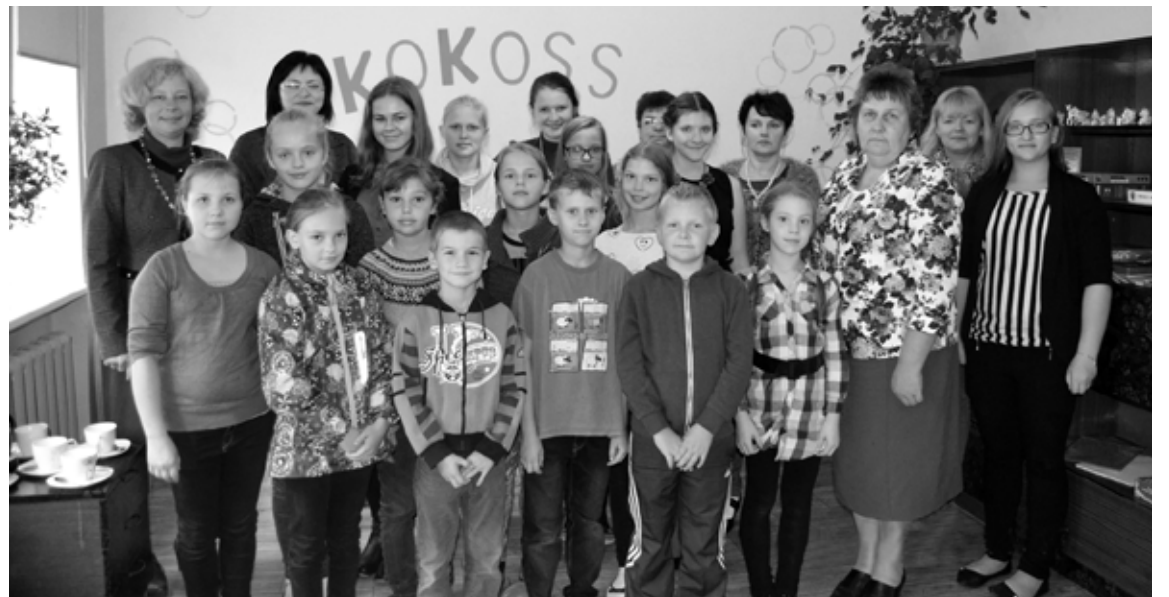
Liepnas vidusskolā jaunieši izveidojuši atpūtas telpu "Kokoss", kura arī organizē dažādas aktivitātes