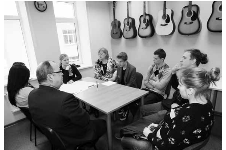
Jauniešu un politiķu tikšanās ritēja darba grupās

Četrās grupās „Kafija ar politiķiem” dalībnieki diskutēja un izvirzīja idejas, kā veicināt jauniešu un lēmumu pieņēmēju savstarpējo uzticību un sapratni, kā pilnvērtīgi iesaistīties lēmumu pieņemšanā, kā šajā procesā iesaistīt jauniešus ar atšķirīgi pieredzi un attieksmi, kā arī, kā efektīvi sadarbīties ne