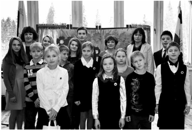
Strautiņu mazpulcēni Atē

Katrs mazpulks bija sagatavojis kādu priekšnesumu. Pēc solījuma došanas visi kopā dziedājām mazpulku himnu. Tad mazpulcēni bija gatavojuši darbnīcas, kurās paši izgatavoja dažādus rokdarbus, piemēram, rokassprādzes. Jaunie mazpulcēni devās mājās ar jaunu