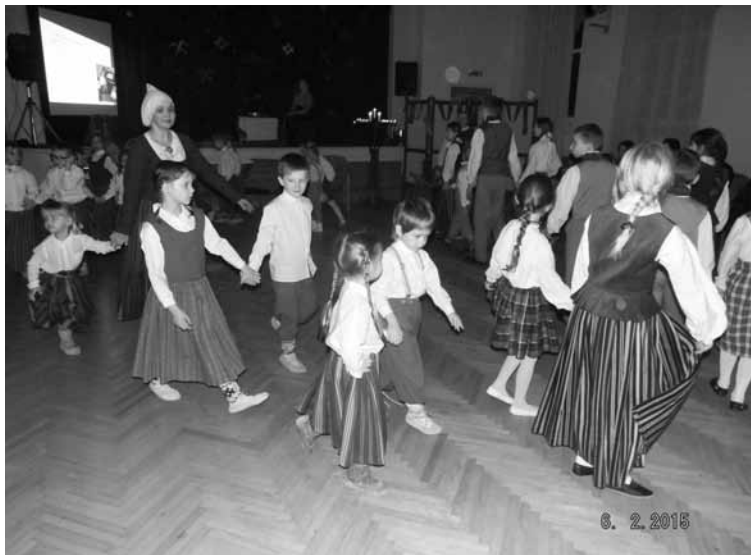
„Pūcītes” audzēkņi rāda savas tradicionālo rotaļu prasmes