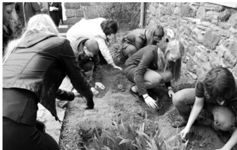
Tiek stādītas rozes, ko Vetinai dāvināja alūksnieši

Alūksnes novada pašvaldības pārstāvji novērtējuši, ka Vetinas Burgģimnāzija, lai gan atrodas lielā Zāles rajona nomalē, ir ļoti pieprasīta skola - tajā mācās ap 900 skolēnu. Skola specializējusies mākslas novirzienā.