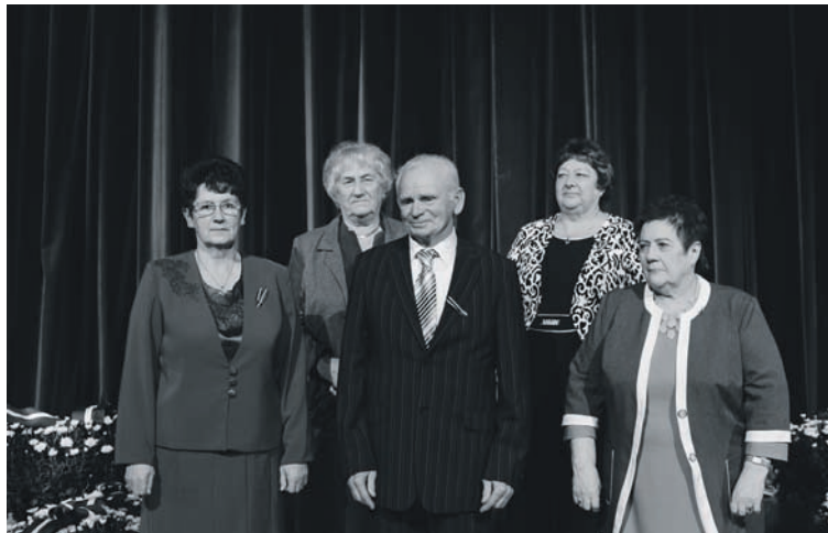
17. novembrī pašvaldības atbalvojums “Sudraba zīle” nonāk pie pieciem novada iedzīvotājiem

Alūksnes Pilssalā uzsāk stadiona servisa centra ēkas ierīkošanu. Jaunlaicenes bibliotēka svin 65