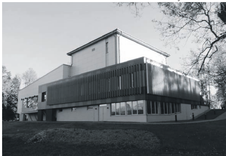
Rudenī aktīvu darbu sāk Alūksnes Kultūras centrs

Ar klasiskās mūzikas koncertu Alūksnes ev. lut. baznīcā Alūksnes Mūzikas skola aizsāk 70 gadu jubilejas cikla koncertus.