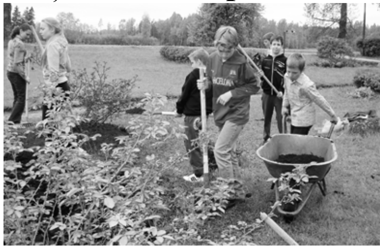
5. klase iekārto jaunu košumkrūmu dobi pie skolas

Nodarbojamies arī ar krāsošanu - pārkrāsojam spēļu laukuma šūpoles, slīdkalniņa balstus un kāpnītes, kā arī sporta laukuma ierīces košās krāsās. Pašu gatavotās koka atkritu-