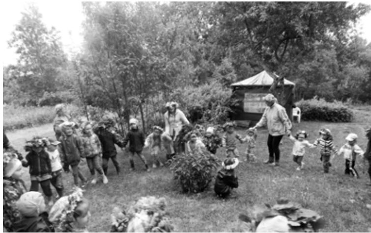
Pirmsskolas izglītības „Pūcītē” audzēkņi iepazīst Jāņu tradīcijas

Un lielais brīdis ir klāt! 19. jūnijā atzīmējam latviešu gadskārtu svētkus – Jāņus, viesojoties pie labiem ļaudīm un ne tikai aplūgot ar dziesmām un dejām, bet arī izgatavojot lielo vainagu, ar kuru apjozt saimnieka kurto ugunskurru. Ugunsкура iedegšana, saules rata ripināšana no kalna, dažādas muzikālas rotaļas, ķīlu izpiršana, mielošanās ar Jāņu sieru, pīrāgiem un paša Jāņa sveikšana bija šīs svētku dienas pamatā.