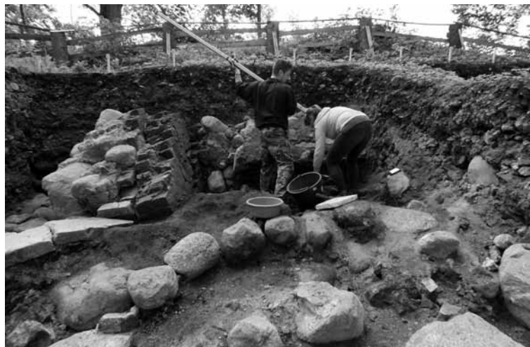
Arheoloģiskie izrakumi Alūksnes viduslaiku pils teritorijā rit veiksmīgi