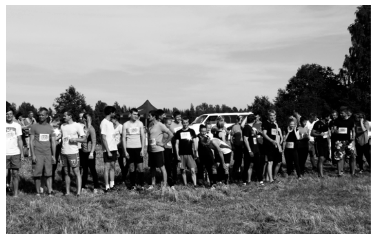
Stipro skrējiens Ilzenē kļūst arvien populārāks

Skrējienu organizēja Ilzenes pagasta pārvalde sadarbībā ar Alūksnes novada pašvaldību, „Sporta, kultūras, interešu izglītības un mūžizglītības centru „Dailes””.