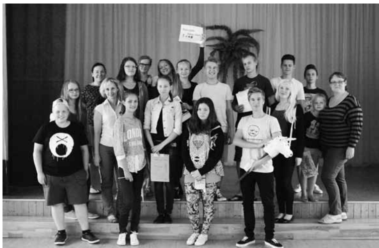
Projekta aktivitāšu laikā jaunieši apguvuši daudzas jaunas iemaņas Projekta publicitātes foto

Augusts kļuva par jauniešu izstrādāto projektu realizēšanas mēnesi. Ilzenē nojume pie skolas ieguva brīnišķīgu gleznojumu, Jaunannā tika papildināta Bebru dabas taka ar Sajūtu takas posmu, Mārkalnē jaunieši beidzot piepildīja vajadzību pēc ērta soliņa, kur izmantot bezvadu internetu, savukārt sportiskajā Veclaicē jauniešu rokām tapa uzlabots tik nepieciešamais volejbola laukums. Šādās neformālās izglītības aktivitātēs jaunieši var gūt ārkārtīgi daudz jaunu zināšanu un prasmju, kas var palīdzēt turpmākajā dzīvē. Visa projekta gaitā jaunieši tika mudināti sekot līdzi un izvērtēt, ko iemācījušies, kādu pieredzi un atziņas guvuši projekta laikā. Tas darīts,