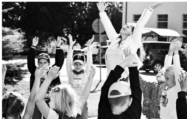
Mazie pirmklasnieki, apgūstot jauno skolas dzīvi pirms mācību gada sākuma, tikās rīta aplī

Šogad saviem pirmklasniekiem piedāvāsim apgūt datorprasmes, jo iesaistījāmie Izglītības un zināt- nes ministrijas, Valsts izglītības satura centra sadarbībā ar Latvijas Informācijas un komunikācijas tehnoloģijas asociāciju pilotprojektā „Datorika” 1. klasei, kur pirmais uz- devums būs droša interneta lietoša- na. Sen nav noslēpums, ka bērni jau pavisam mazi sāk interesēties par IT jomu, tādēļ svarīgi to pareizi apgūt pēc iespējas ātrāk kopā ar profesio- nālu skolotāju. Mācību programmu „Datorika” aprobāciju īsteno 157 izglītības iestādēs, paredzot agrīnā- ku digitālās kompetences attīstību.