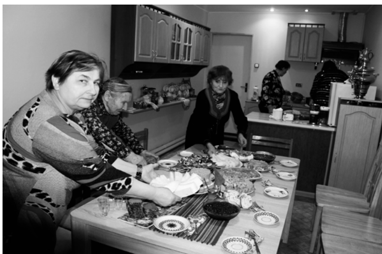
Pededzē interešu grupas atzinīgi novērtējušas jauno telpu

Projekta ietvaros ar biedrības spēkiem telpā veikts kosmētiskais remonts un tās pielāgošana virtuves iekārtu prasībām, par projekta līdzekļiem iegādātas vajadzīgās mēbeles un virtuves piederumi. Jauno telpu savām aktivitātēm jau