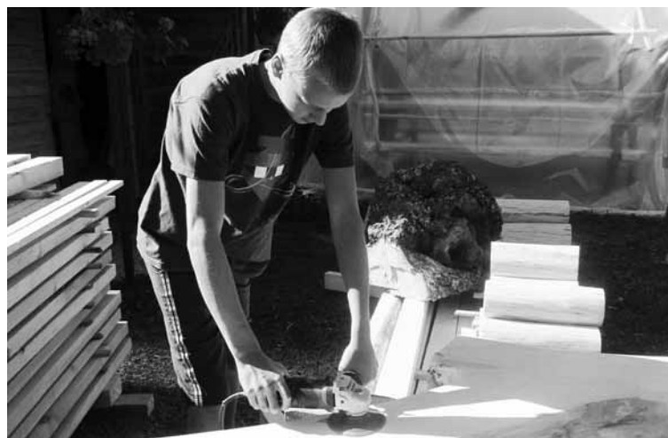
Īstenojot projektu, jaunieši daudz darbus veikuši pašu spēkiem

lai dalībnieki mācītos uzņemties atbildību par savu izaugsmi un apzinātos, cik nozīmīga ir paša cilvēka aktivitāte un ieinteresētība mācīšanās procesā. Noslēgumā tie dalībnieki, kas vēlējas, saņēma gūto pieredzi apliecināšu dokumentu. 29. augustā pulksten 11.00 gan iesaistītie jaunieši, gan ikviens interesents tikās Vēlajā brokastī, lai atskatītos uz projektā paveikto un gūto iedvesmu laikam līdz nākamajai vasarai!