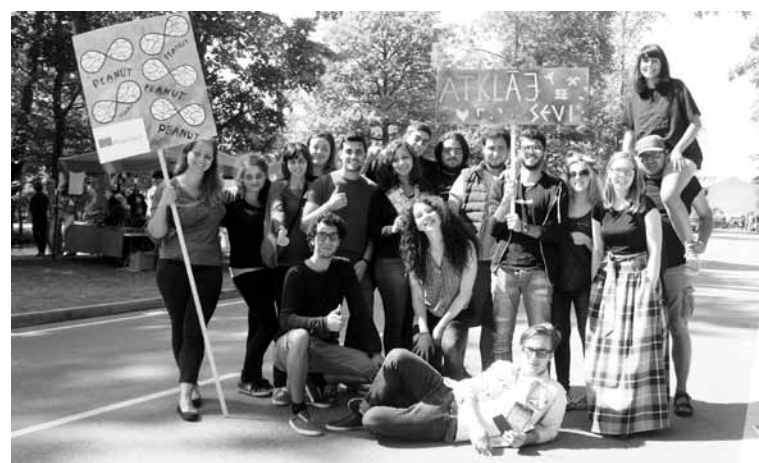
Projekts “PEANUT” palīdzēja atklāt sevi un apkārtējos, veicināt cilvēku iesaisti sabiedriskajos procesos

Informācija pa tālruni: 64322402; 29190552, www.abjc.lv ; Dārza iela 8a, Alūksnē