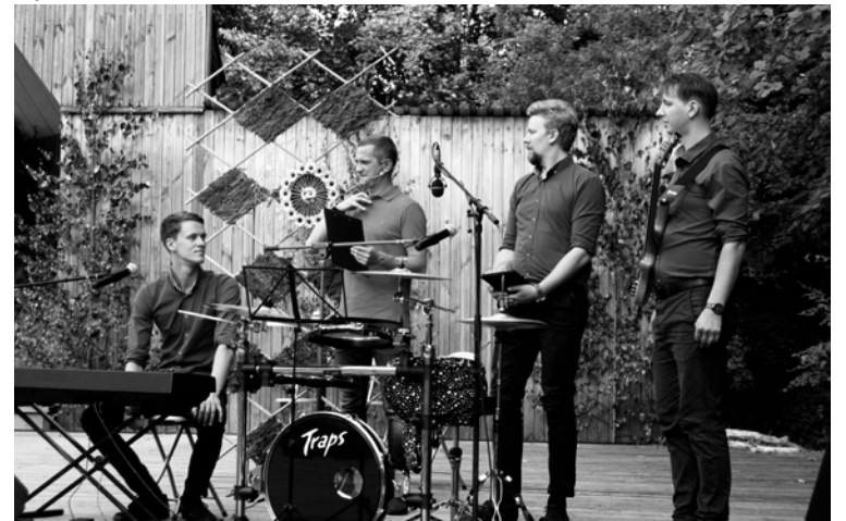
Grupa „Dziļi violets” un Karaliskais Improvizācijas teātris Zeltiņos