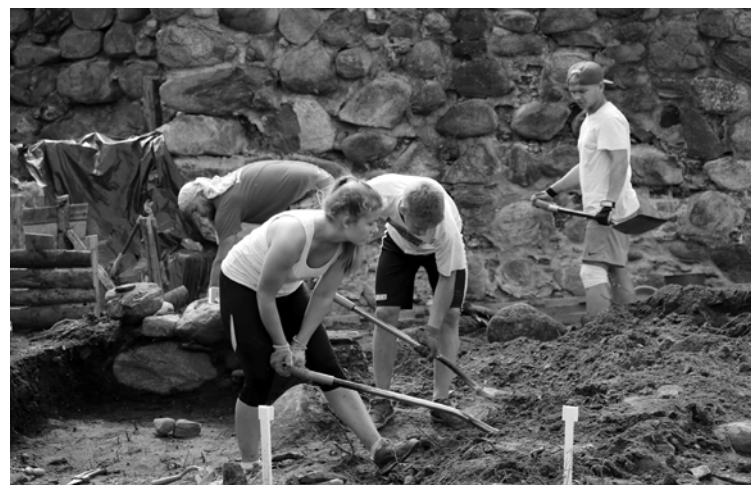
Jaunieši arheoloģiskajos izrakumos Pilssalā strādā arī šogad