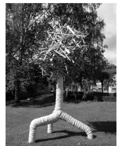
Vides objekts “Dzīvības koks”

Ar visu rakstā minēto skulptūru un vides objektu fotoattēliem var iepazīties www.aluksne.lv .