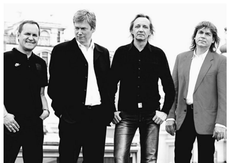
Grupa “BET BET”