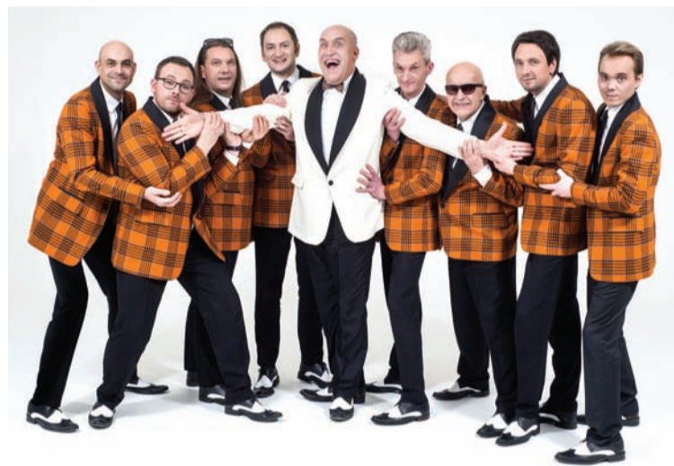
“Big Al & The Jokers”