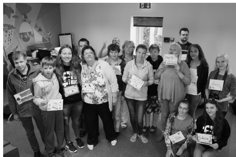
AUTOBUSS komanda kopā ar dienas aprūpes centra “Saulės stars” apmeklētājiem

Jau 5. jūlijā jaunieši MJIC “Pa GALMS” ar dienas aprūpes centra “Saulės stars” apmeklētājiem pavadīja divas stundas, īstenojot savu izstrādāto plānu. Kopā tika veidoti radoši darbi, nedaudz sportiskas aktivitātes. Kā kulminācija bija divās komandās dalībnieku veidotu svaigu olu nosargāšanas konstrukciju izmēģināšana, kad tās tika mestas no 2. stāva. Secinājām, ka sadarbība ar dienas aprūpes centru bija ļoti patīkama un vērtīga. “AUTOBUSS” komandas jaunieši vēlāk atzina, ka pirms pasākuma bija satraukti, māca