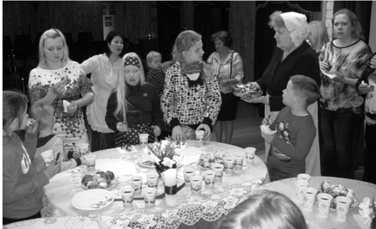
Pasākuma noslēgumā 4. maijā dalībnieki pie balti klātiem galdiem cienājās ar vecmāmiņas ceptām pankūkām, kliņģeriem un citiem svētku gardumiem

4. jūnijā projekta ietvaros notika izglītojošs pasākums bērniem un jauniešiem „Dāvana no sirds”. Radošajā darbnīcā bija iespēja iemācīties izgatavot dāvanas Latvijai - svētku rotājumus ar gaismas elementiem, ar latvju zīmēm apgleznotus akmeņus, piespraudes. Darbojoties praktiski, tika iegūtas arī zināšanas par latvju zīmēm, par krāsu nozīmi. Pašu