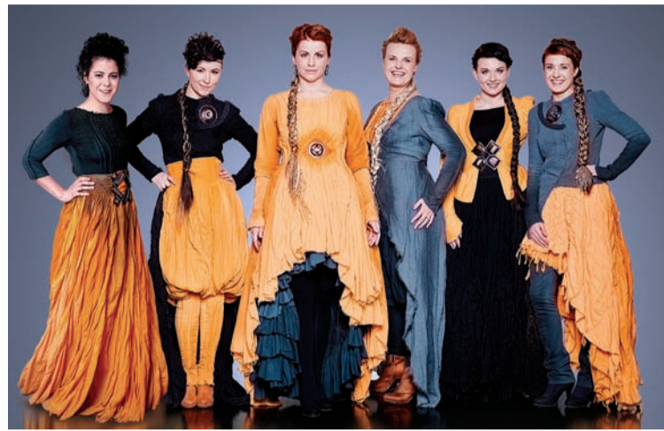
Vokālā grupa “Latvian Voices”

No 6. augusta pulksten 14.00 līdz 7. augusta pulksten 7.00: