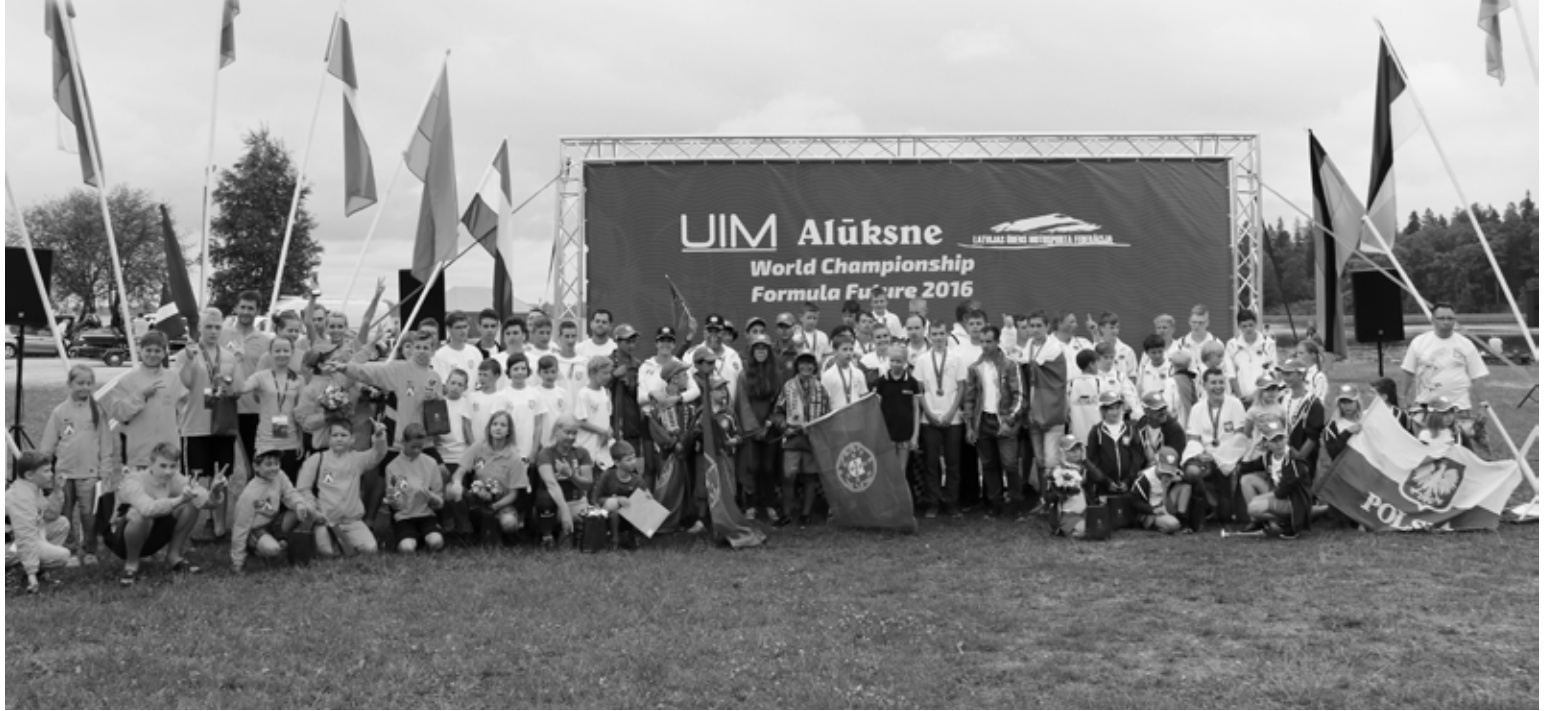
Visas komandas, Pasaules čempionāta ūdens motosportā dalībnieces mirkli pēc apbalvošanas ceremonijas