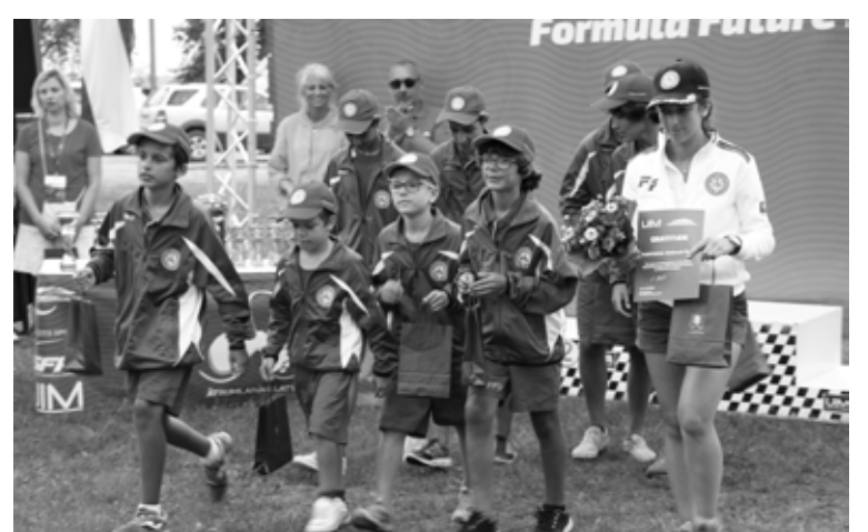
Visatraktīvākā no sacensību dalībniekiem bija Portugāles komanda