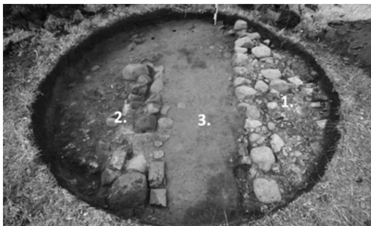
Plānotā ugunsкура vieta iepretim piknika nojumei Nr. 2 ar tajā atklātajām konstrukcijām: 1. – mūra siena; 2. – iespējamā krāsns konstrukcija; 3. – domājams grīdas līmenis (māla klons)

tuvumā nolēmusi neveikt nekādus būvdarbus un neizbūvēt šai vietā