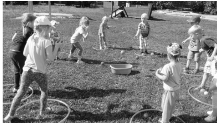
„Sporta aktivitātes “Latvijas veselības nedēļa” 2016” pasākuma ietvaros