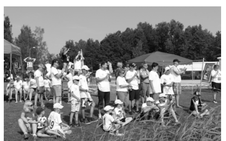
Līdzjutēji pusfināla un fināla braucienos jaunos sportistus atbalstīja dedzīgi