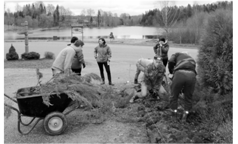
Notiek celiņa pārbūve