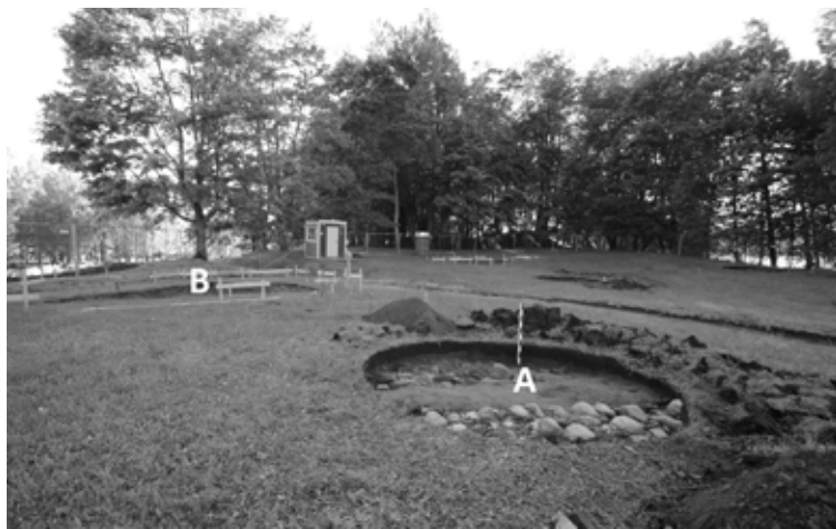
Kopskats: A – plānotā ugunsкура vieta iepretim piknika nojumei Nr. 2; B – plānotās piknika nojumes Nr. 2 vieta

Lai saglabātu atklātās arheoloģiskās liecības, Alūksnes novada pašvaldība atklāto konstrukciju tiešā