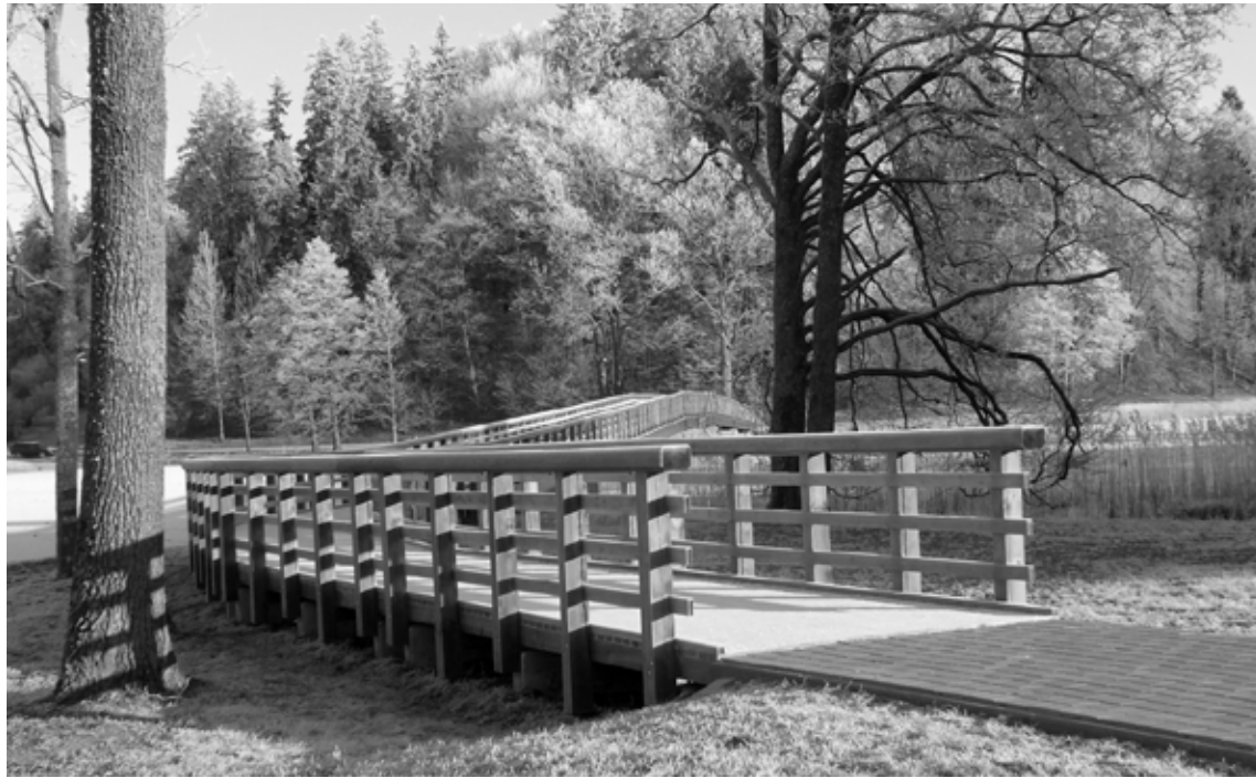
Jaunais gājēju tilts uz Tempļakalnu ir guvis lielu apmeklētāju ievērtību

Alūksnes novadā pēdējo gadu laikā paveikti apjomīgi tūrisma infrastruktūras sakārtošanas darbi. Eksploatacijā nodots Tempļakalna ielas gājēju tilts, kurš nesēn ticis arī pie apgaismojuma un gaida pavasari, kad tiks uzstādītas apskaņošanas iekārtas. Ugunsnovērošanas skatu