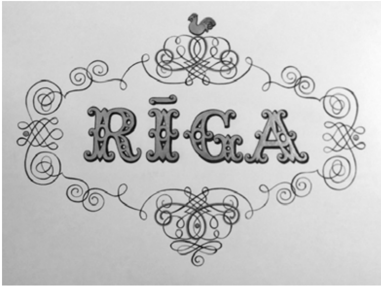
Kaligrāfijas izstādē Viktora Ķirpa Ates muzejā