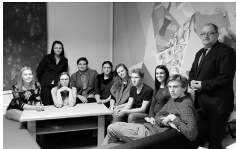
Alūksnes novada Jauniešu konsultatīvās padomes esošie un jaunie dalībnieki pirmajā šī gada sanāksmē