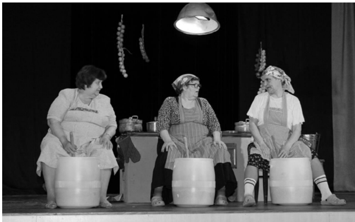
Aina no izrādes “Dūdotāji”