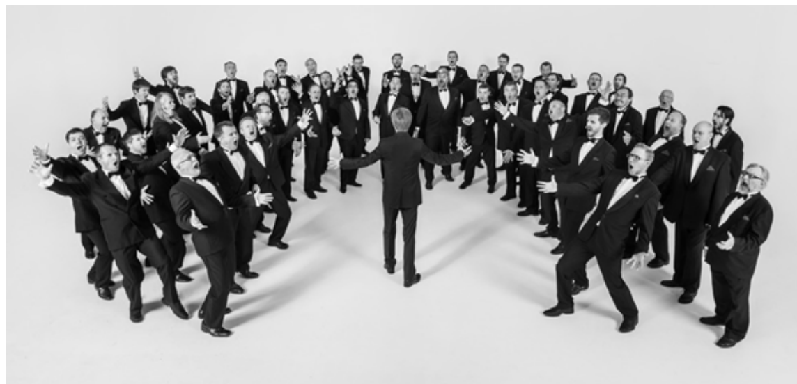
Igaunijas Nacionālais vīru koris "RAM" 4. martā koncertēs Alūksnē