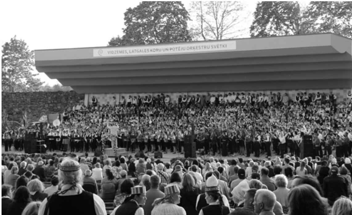
Dziedātāji un mūziķi no Vidzemes, Latgales, arī Kurzemes un Zemgales 28. maijā Alūksnē radīja mazos dziesmu svētkus

Svētku koncertā piedalījās kori no Aizkraukles, Alūksnes/Balvu/Gulbenes, Bauskas, Cēsu, Daugavpils, Saldus, Jelgavas, Jēkabpils, Ogres, Pierīgas, Rēzeknes/Ludzas, Rīgas, Sīguldas, Talsu, Valmieras/Valkas un pat Ventspils/Kuldīgas kora aprīņiem. Savukārt pūtēju orķestru pulkā bija 14 kolektīvi no Vidzemes – Smiltenes, Alūksnes, Inčukalna, Cēsīm, Valmieras, Limbažiem, Gulbenes, Birzgales, Strenčiem, Rūjienas, Lejasciema, Salaspils un Cēsvaines, kā arī 10 pūtēju orķestri no Latgales reģiona – Balviem, Rēzeknes, Preiļiem, Krustpils, Dekšāres, Kārsavas, Jēkabpils,