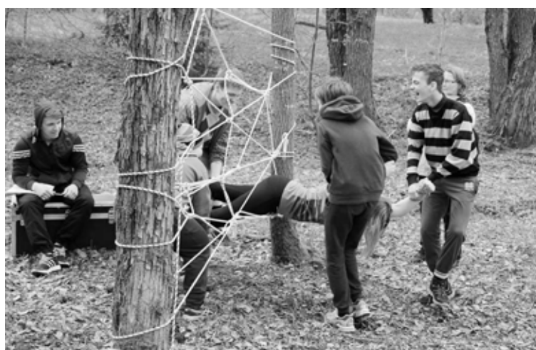
Skolēni demonstrē izveicību pārbaudījumā “Zirneklis”

Skolēniem bija iespēja gūt priekšstatu par valsts aizsardzības mācību. Komandas veidoja savu vairogu. Pārbaudīja zināšanas drošības testā, piedalījās stafetē, kurā pārbaudīja zināšanas medicīnā, spēku un vienotību mašīnas vilkšanā, apguva iemaņas sazināties caur rācijām, parādīja savu izveicību un atjautību pārvietojoties purvā, orientēšanās