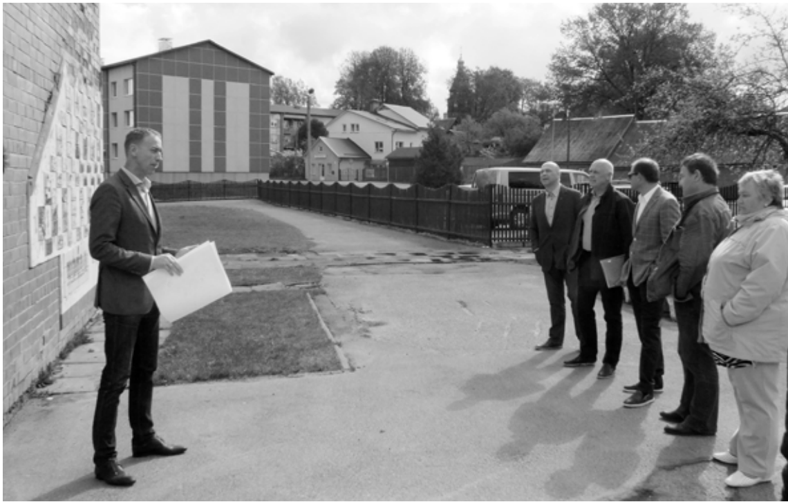
Tautsaimniecības komitejas sēdes laikā deputāti iepazīs ar abām iespējamām būvvietaīm