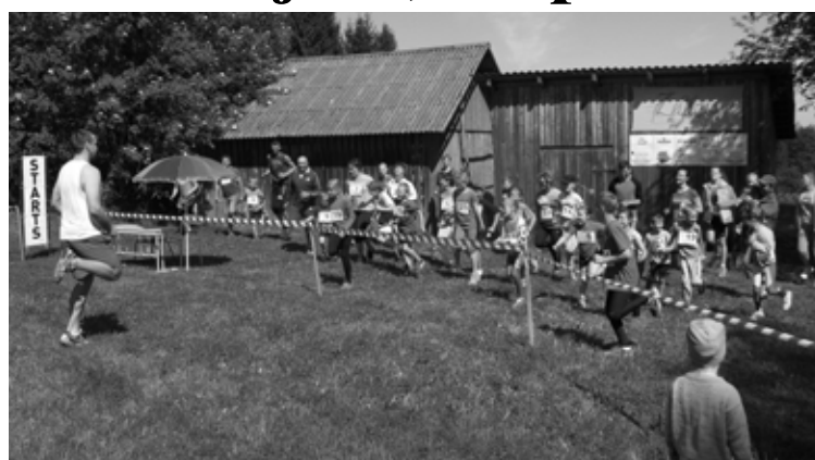
Skrējiena dalībnieki pirms sacensībām iesildās