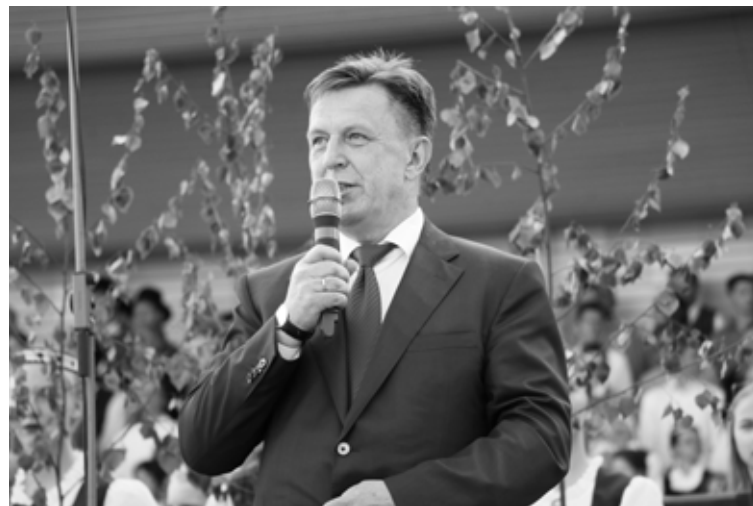
Vidzemes un Latgales kora un pūtēju orķestru svētkus atklāj Ministru prezidents Māris Kučinskis

Svētkus organizēja Alūksnes novada pašvaldība un Latvijas Nacionālais kultūras centrs, atbalsta Vidzemes plānošanas reģions un Valsts Kultūrkapitāla fonds. Pasākuma rīkotāji pateicas ikvie-