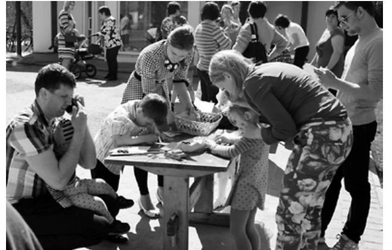
Viena no radošajām darbnīcām „Rociņu sirsniņas”

Savu PALDIES svētkos vēlējas teikt arī Jaunannas Tautas nama