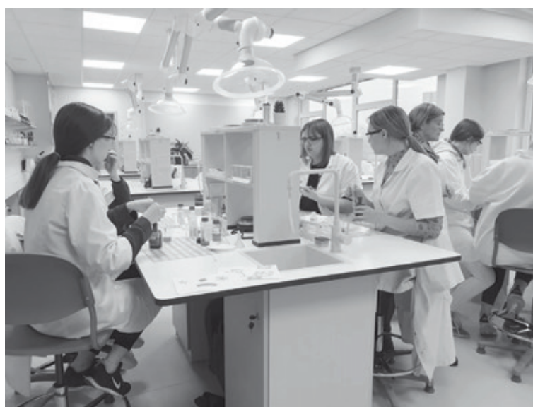
Jaunā ķīmijas laboratorija atjaunotajā skolas korpusā skolēniem ir viens no būtiskākajiem ieguvumiem

Darbus veica SIA "RERE MEISTARI", autoruzraudzību nodrošināja SIA "REM PRO" un "Sestais stils" apvienība, būvuzraudzību – SIA "Būvzraugi LV". Projektu vadīja Alūksnes