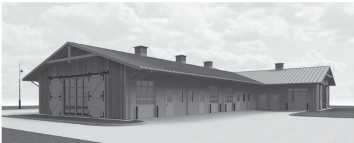
SIA "Arhitekta L. Šmita darbnīca" vizualizācija

Click sistēmas saplākšņa standus vietējiem uzņēmumiem un eksportam.