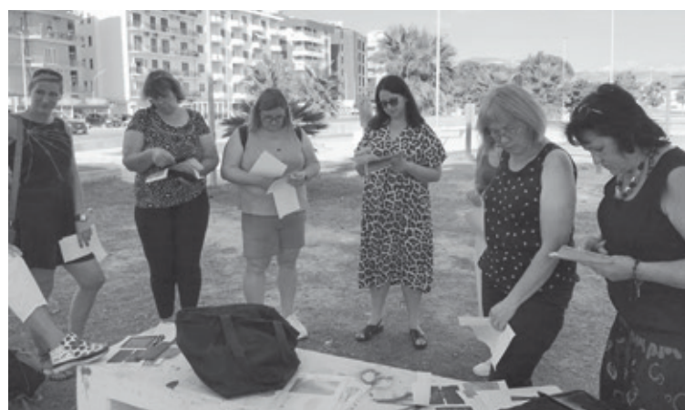
Āra nodarbība, kā atlasīt un strukturēt nepieciešamo informāciju

Āra nodarbībās apguvām metodes, galvenokārt, izmantojot spēļu elementus, kā izglītojamajiem pilnveidot prasmes lietot ES dokumentus nepieciešamās informācijas iegūšanai un izvērtēšanai, kā veidot izpratni par atkritumu šķirošanas nozīmīgumu; kā definēt un izspēlēt nopietnu ekoproblēmu ar TV šova formāta palīdzību un kā analizēt infografikās iekļauto informāciju. Kursu trenere Roberta mudināja ieklausīties, izjust dabas krāšņumu caur savām sajūtām,