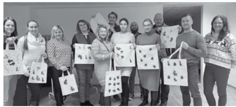
Alūksnes novada uzņēmēji pieredzes braucienā varēja arī paši izmēģināt sietspiedes praktisko darbnīcu vienā no Madonas novada apmeklējamiem uzņēmumiem

Kopš 2022. gada janvāra Latvijas investīciju un attīstības aģentūras Madonas biznesa inkubatora atbalsta vienība atrodas Alūksnē, tādēļ 14. decembrī Alūksnes novada topošie un esošie uzņēmēji devās pieredzes apmaiņas braucienā uz Madonas un Gulbenes novadiem, lai iepazītu LIAA Madonas biznesa inkubatora klientus.