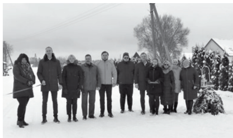
Alūksnes novada pašvaldības pārstāvji kopā ar vietējiem uzņēmējiem svinīgajā ceļa atklāšanas brīdī Mārupē