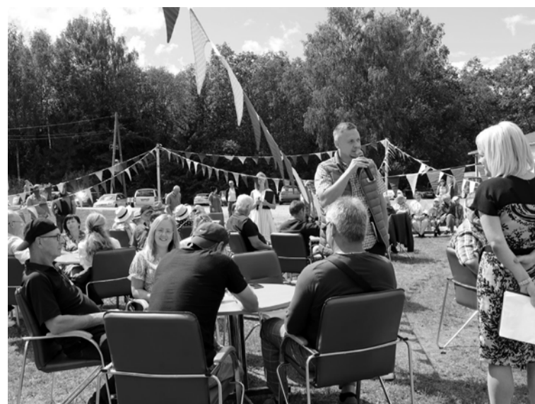
Alsviķu pagasta kopienu svētkos spēlēt satikās vairāku pagastu apdzīvoto vietu komandas, lai pārbaudītu savas zināšanas par pagastu

No 18.00 pie Māriņkalna tautas nama Ziemera pagasta kopienu svētki "Baltais randiņš". Līdzī ņemam ko garšīgu kopīgam cienastam un īpašās svētku sajūtas radīšanas galvenais un