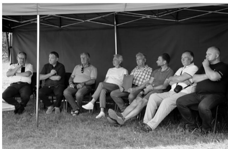
Paneldiskusija Liepnas kopienu svētkos