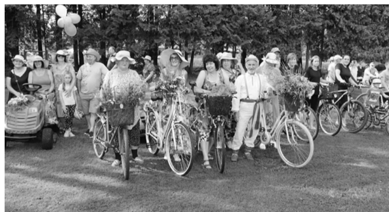
Jaunannas kopiena dienu iesāka ar maksšķerēšanu un kopīgu velo, moto un citu braucamrīku braucienu