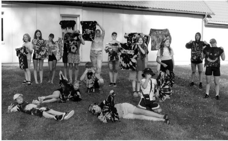
"Divdienis" ir tradicionāla vairāku dienu nometne jauniešiem Jaunannas pagastā

Jaunannas jauniešu klubs "Tikšķis" šovasar organizēja tradicionālo divu dienu nometni ar darbošanas aktivitātē atpūtas vietā "Zaķusala" un Jaunannas tautas namā. Šogad nometne notika 25.-26. jūnijā, tās nosaukums bija "Nedaudz no visa", un, atbilstoši nosaukumam, šajās divās dienās jauniešiem tika dota iespēja darboties gan sportiski, gan mākslinieciski un attīstīt teātra un komunikācijas prasmes.