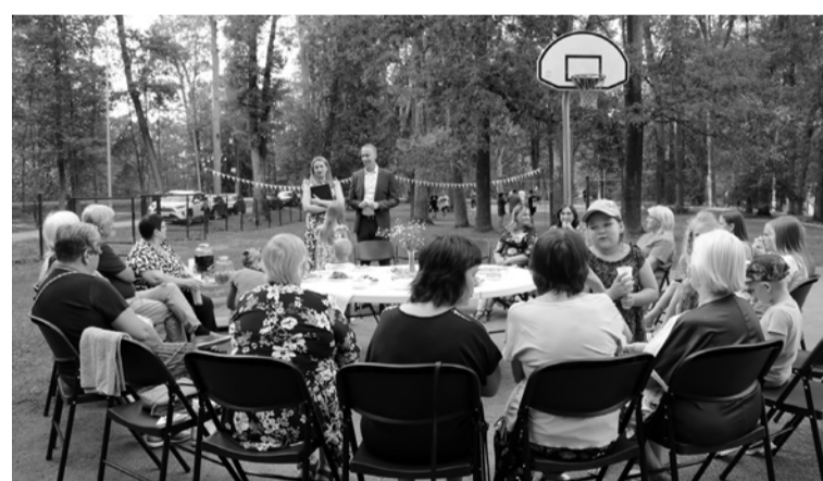
Jaunlaicenes pagastā kopiena vispirms labi pastrādāja, atjaunojot sporta laukumu, un tad tikās kopīgos svētkos