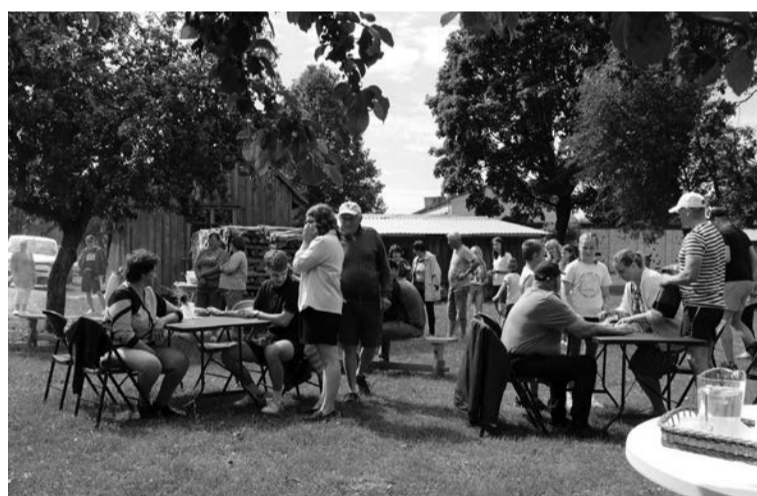
Malienas kopienu svētkos ļaudis spēlēja galda spēles, sporta spēles un arī nu jau atdzimušo punu