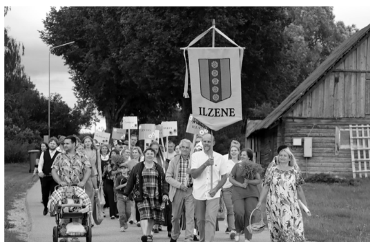
Ilzenieši uz svētku norises vietu devās svinīgā gājienā ar pagasta karogu