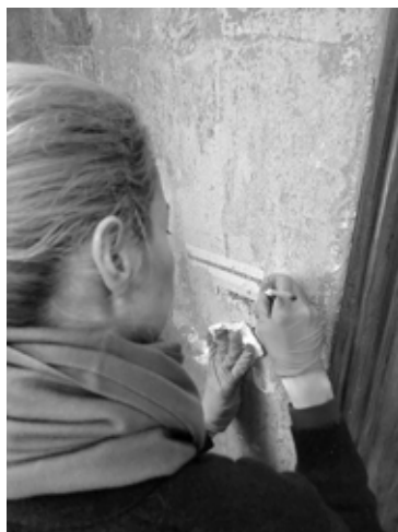
dekoratīvo neogotikas stila gleznojumu.

Alūksnes novada muzeja mērķis ir atgūt pils autentisko kāpņu telpas sienu gleznojumu, kas pils apmeklētājiem radīs vizuālu iespaidu par 19. gs. beigu – 20. gs. sākuma interjera