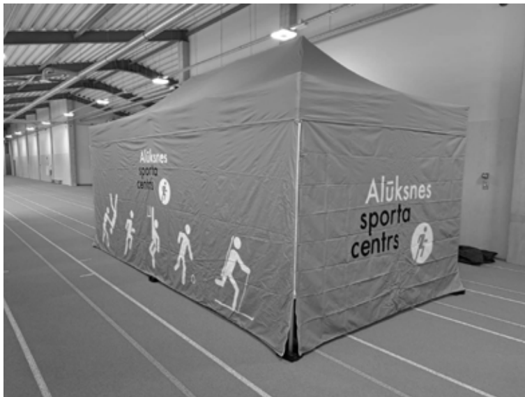
Alūksnes Sporta centra aprīkojumā esošā telts

• 7. novembrī pašvaldībā saņemts Vientotās pašvaldību sistēmas uzturētāja SIA "ZZ Dats" paziņojums par kibernetikas incidentu, kura laikā nenoskaidrotas personas no vairākām interneta vietnēm ir piekļuvušas "ZZ Dats" uzturētās Vientotās pašvaldību sistēmas atsevišķām datubāzēm un ieguvušas tajās glabātos datus. Incidents tiešā veidā skāris 42 Latvijas pašvaldības, izņemot Rīgas valstspilsētas pašvaldību.