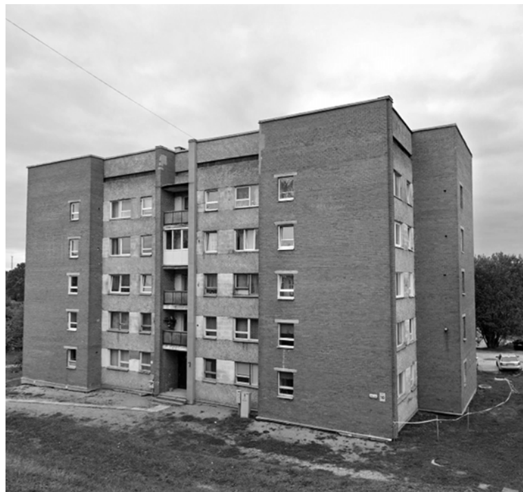
Viens no atsavināmiem pašvaldības dzīvokļiem atrodas Cēsu ielā 10, Alūksnē

Alūksnes novada pašvaldība informē, ka pēc veiktās pašvaldības neizīrēto dzīvokļu inventarizācijas ir izveidots atsavināmo dzīvojamo telpu saraksts.