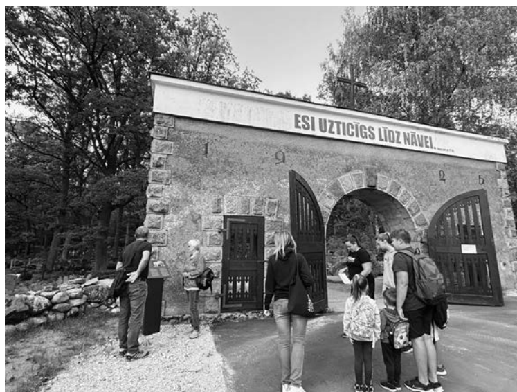
Jaunais maršruts "Mazais loks pa Alūksnes Lielajiem kapiem"

Cauri 17. gadsimtam līdz mūsdienām ved maršruts "Ernsta Glika vārds mūsdienu Alūksnē" , ļaujot iepazīt vācu mācītāja un skolotāja Ernsta Glika nozīmi Alūksnes un Latvijas vēsturē. Mācītāja lielākais devums Latvijas kultūrvēsturē ir Bībeles tulkojums no senajām valodām latviešu valodā, ko Gliks paveica, dzīvojot un strādājot Alūksnes draudzē. Latviešu valodā aizvien lietojam daudzus vārdus, ko Gliks radīja Bībeles tulkošanas laikā, piemēram,