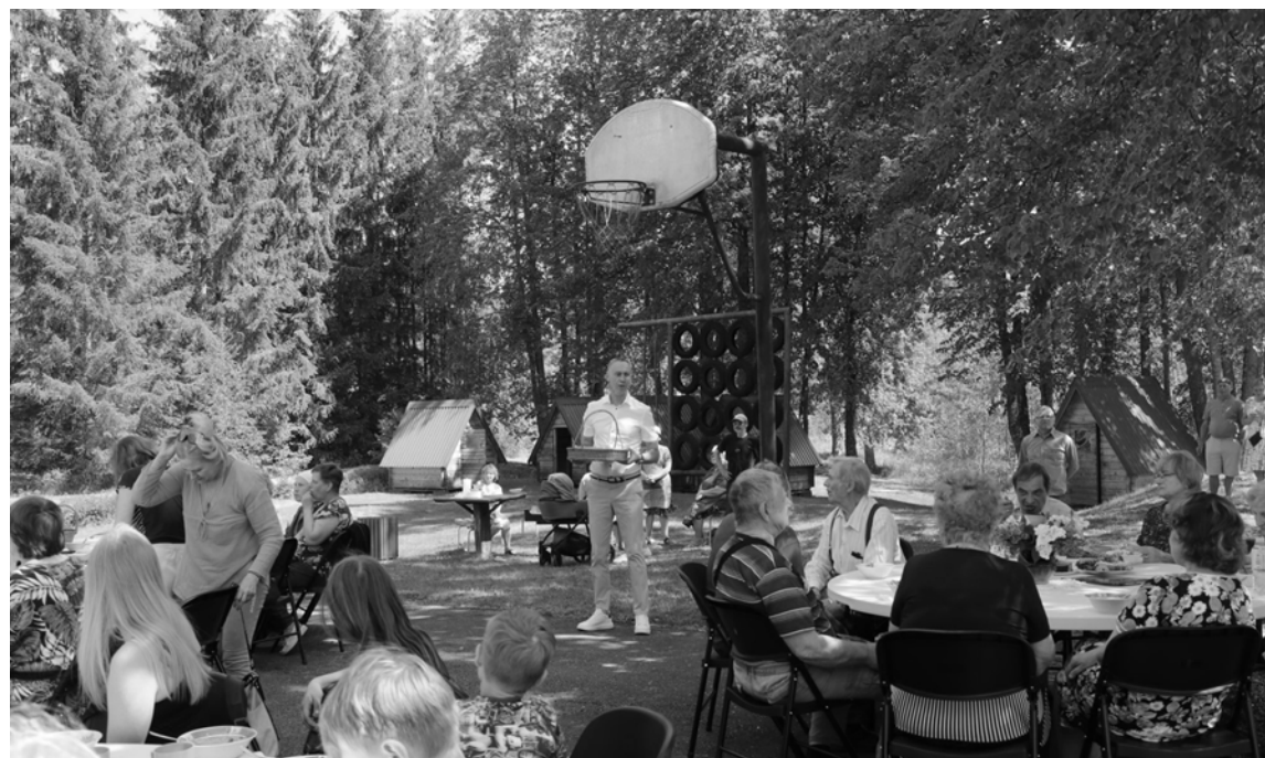
Zeltinieši radoši, darbīgi un priecīgi pirmie uzsāka šīs vasaras kopienu svētku maratonu

Aicinām piedalīties kopienas makšķerēšanas sacensībās pie Pededzes, ziedu paklāja veidošanā pie Jaunannas tautas nama, fotoorientēšanās spēlē, bērnu velosacensībās, radošajās darbnīcās. Kopienas uzņēmēji, amatnieku, zemnieku, rokdarbnieku, kūku cepēju "lielīšanās" ar savu produkciju, tās apskate un degustācija ar iespēju iegādāties. Svētku noslēgumā pulcēsimies uz kopīgām sarunām par kopienas turpmākajām iecerēm, baudīsim muzikālus, kopienas ģimeņu un interešu grupu sagatavotus