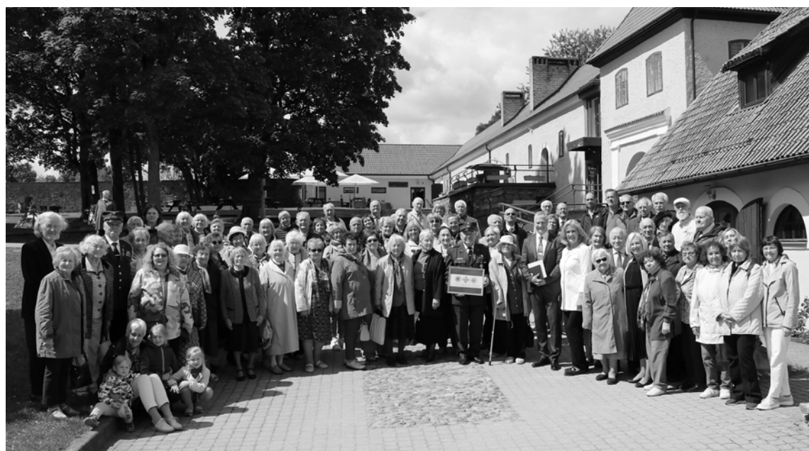
Latvijas Ordeņu brālības 25. salidojums Tukuma novadā 2023. gada 7. jūnijā