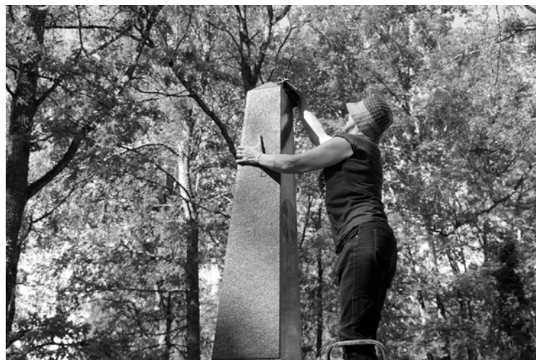
Vispirms zeltinieši kopā pastrādāja Zeltiņu kapos, sakopjot vairākas atdusas vietas