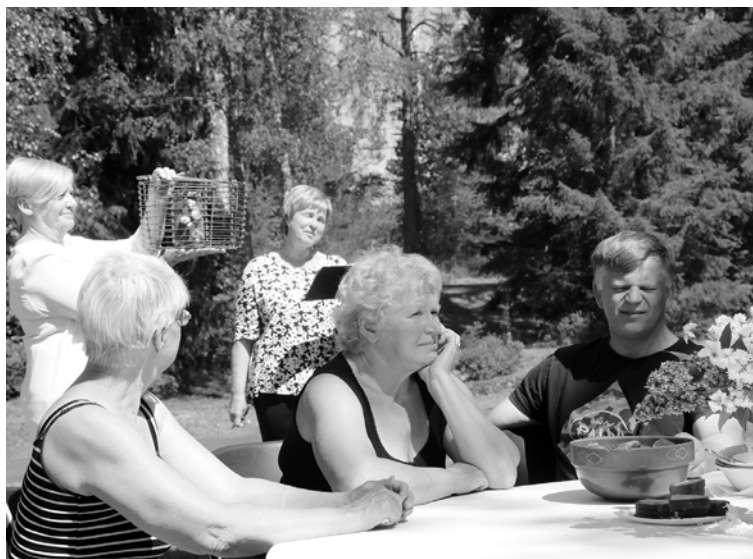
Labdarības izsolē jeb ziedošanas spēlē pasākuma dalībnieki vāca naudu kapsētas uzkopšanas darba rīku iegādei un nojumes ierīkošanai