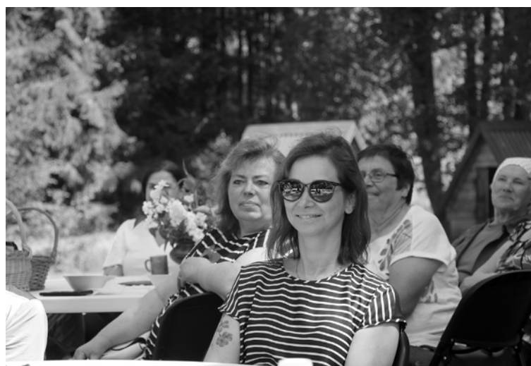
Zeltinieši kopā noskatījās atmiņu stāstus video filmā par izcilām zeltiniešiem un piedalījās labdarības izsolē

14.00-17.00 Liepnas kopienas svētki "Toreiz un tagad" Liepnas upes krastos, Muižas alus brūža un Alekseja Grāviša Liepnas pamatskolas stadionā. Sikāka informācija sekos.