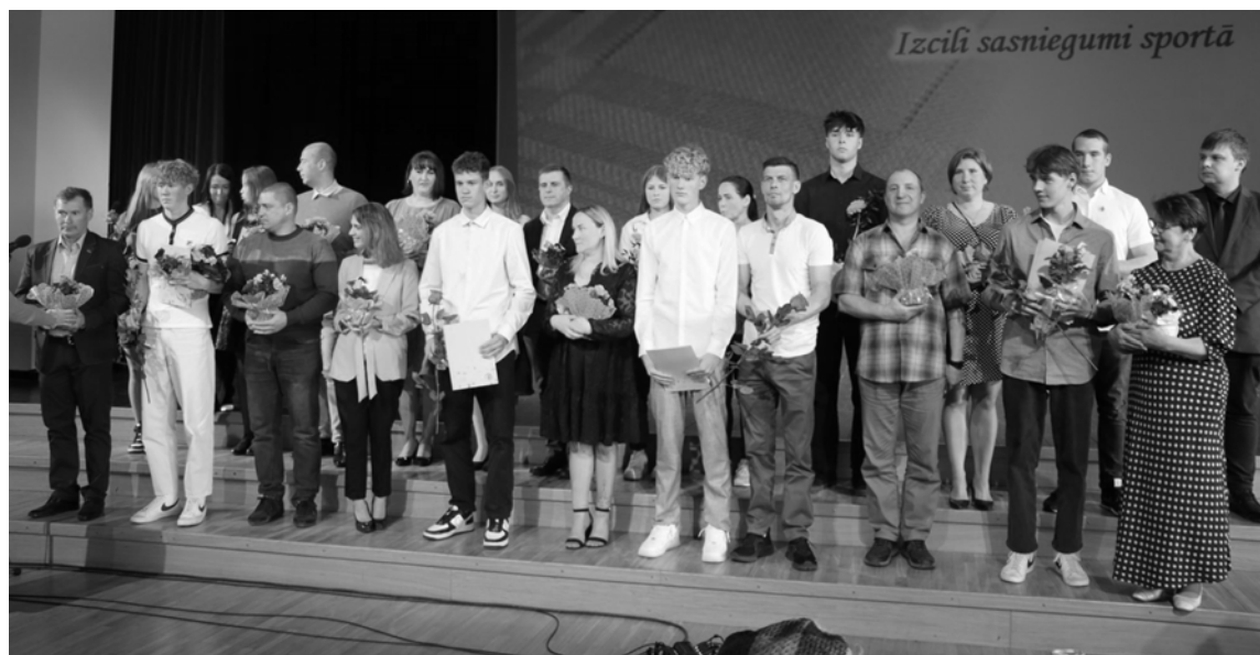
Sumināti arī tie Alūksnes novada skolēni, kas sasnieguši izcilus rezultātus sportā