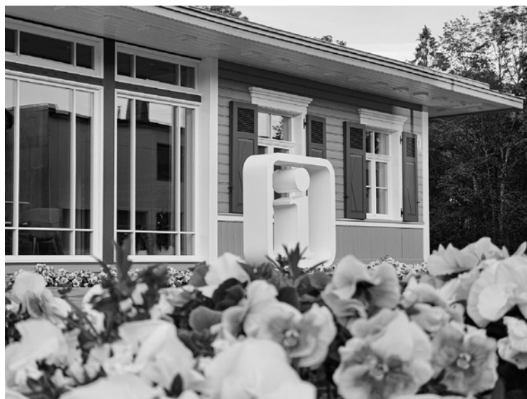
Maršruta starts - pie Alūksnes Tūrisma informācijas centra