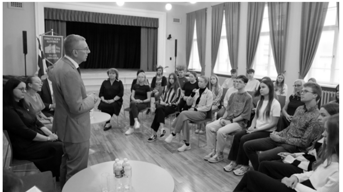
Ernsta Glika Alūksnes Valsts ģimnāzijas vēsturiskā korpusa zālē Valsts prezidents tikās ar ģimnāzijas un Alūksnes vidusskolas jauniešiem