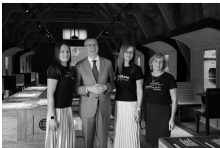
Apmeklējot Alūksnes Bānīša staciju