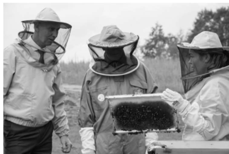
Jaunalūksnes pagasta "Igaunišos" Valsts prezidents iepazīst bišu dzīvi