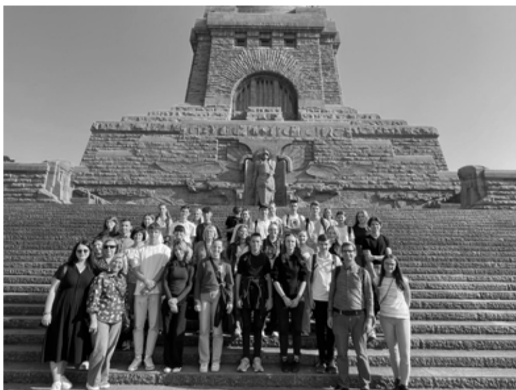
Projekta dalībnieki pie Leipcigas kaujas piemineklja

Hallē jaunieši guva ieskatu arī par Halles vēsturi, slavenākajām personībām, kas šeit dzīvojušas, un atpazīstamākajām vietām. Trešajā dienā projekta komanda apmeklēja Leipcigu. Leipcigas skolu muzejā guva nelielu ieskatu Vācijas Demokrātiskās Republikas vēsturē un piedalījās 70. gadu mācību stundā. Jaunieši guva priekšstatu, kāda bija skolēnu dzīve Austrumvācijas skolās PSRS laikā, diskutēja par demokrātijas un diktatūras