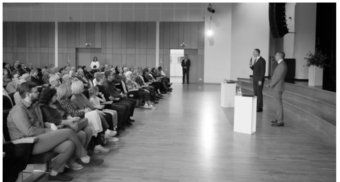
Alūksnes Kultūras centrā Valsts prezidents atbildēja uz Alūksnes novada iedzīvotāju jautājumiem