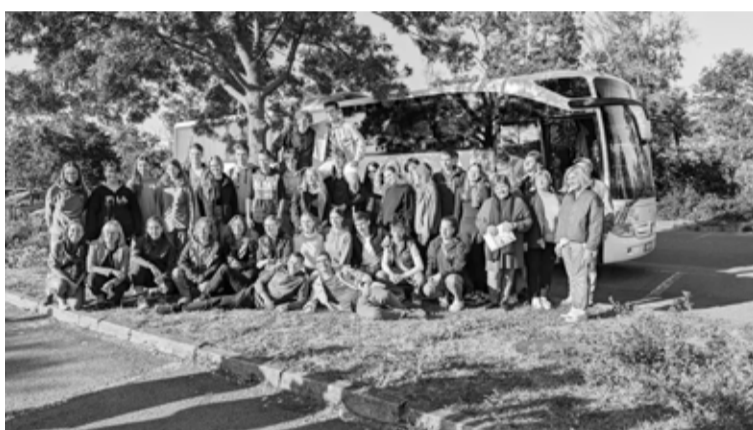
Vācijas projekta dalībnieku kopbildi pirms došanās atpakaļceļā