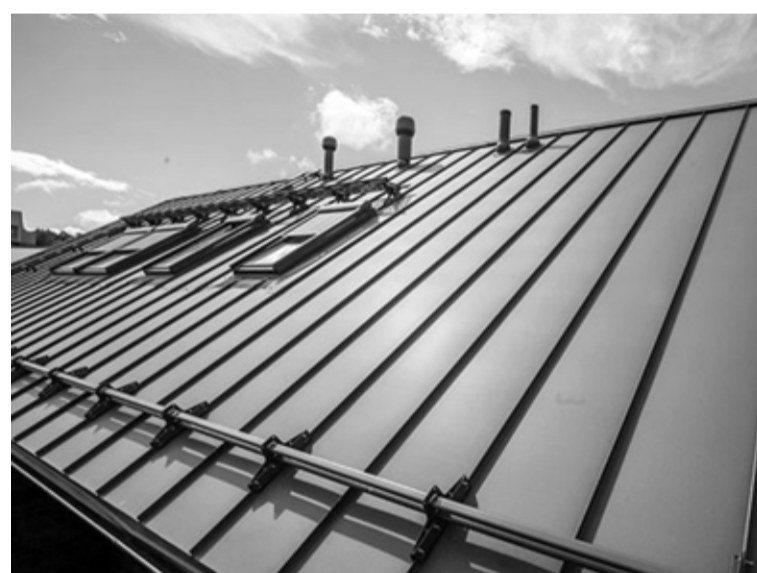
Ja plānojat uzklāt jaunu metāla jumta segumu, viens no pieļaujamajiem materiāliem ir klasiskais valcprofils

Kas jāņem vērā: 1) ēku fasādes krāsošana pilsētā un ciemos jāveic saskaņā ar Būvvaldē saskaņotu krāsu pasi vai būvprojektā akceptēto krāsojumu, 2) lai veidotu vienotu