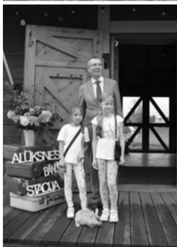
Viesis devās braucienā ar Gulbenes-Alūksnes Bānīti un satiekas ar mazajiem alūksniešiem