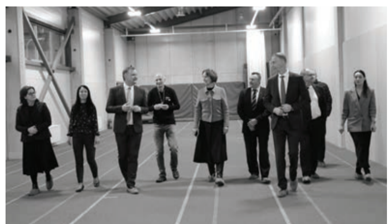
Pēc sarunas pašvaldībā ministre apmeklēja vairākus pašvaldības objektus, tostarp viesojās Alūksnes Sporta centrā