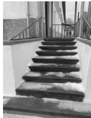
Strautiņos saremontētas kāpnes