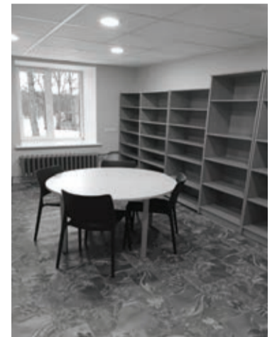
Mārkalnē remonts veikts bibliotēkas telpā