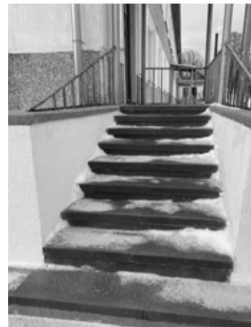
Strautiņos saremontētas kāpnes