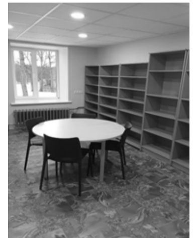
Mārkalnē remonta veikta bibliotēkas telpā