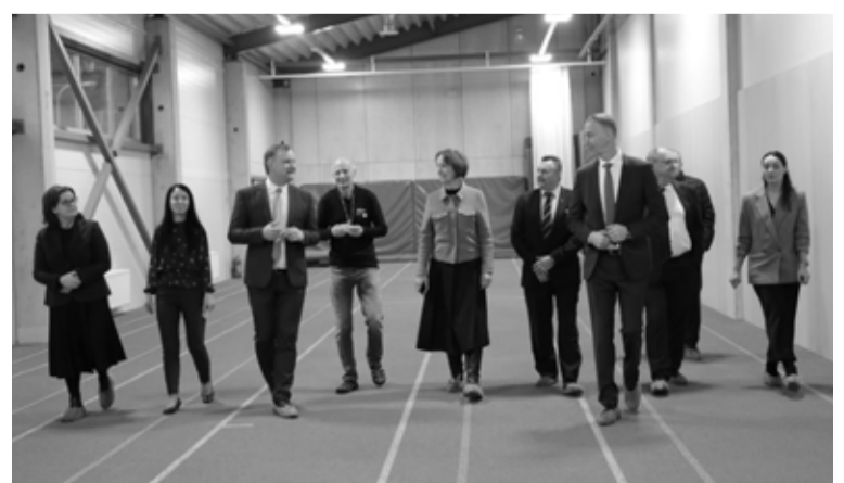
Pēc sarunas pašvaldībā ministre apmeklēja vairākus pašvaldības objektus, tostarp viesojās Alūksnes Sporta centrā