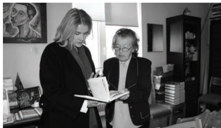
Alūksnes novada Sabiedrības centrā tikšanās ar aktīvāko nevalstisko organizāciju pārstāvjiem

projektiem novada attīstības veicināšanai un nākotnes attīstības iecerēm, kā arī ar pašvaldības skatījumu uz virkni birokrātisku problēmu, kas ietekmē pašvaldību darbu, un priekšlikumiem to risināšanai. Vizītes noslēgumā E. Siliņa apmeklēja Alūksnes novada Sabiedrības centru, kur iepazīšanās