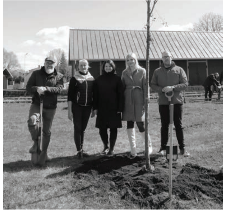
Koku stādīšanā piedalījās arī “Alūksnes putnu fermas” pārstāvji