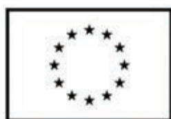
Līdzfinansē Eiropas Savienība

Kursi allaž ir ieguvums – gan apstiprinot, ko zinām, gan papildinot savas zināšanas. Šī pieredze ir nenovērtējams ieguldījums profesionālajā izaugsmē, sniedzot gan praktiskas zināšanas turpmākajam darbam, gan arī svarīgu starpkultūru pieredzi.