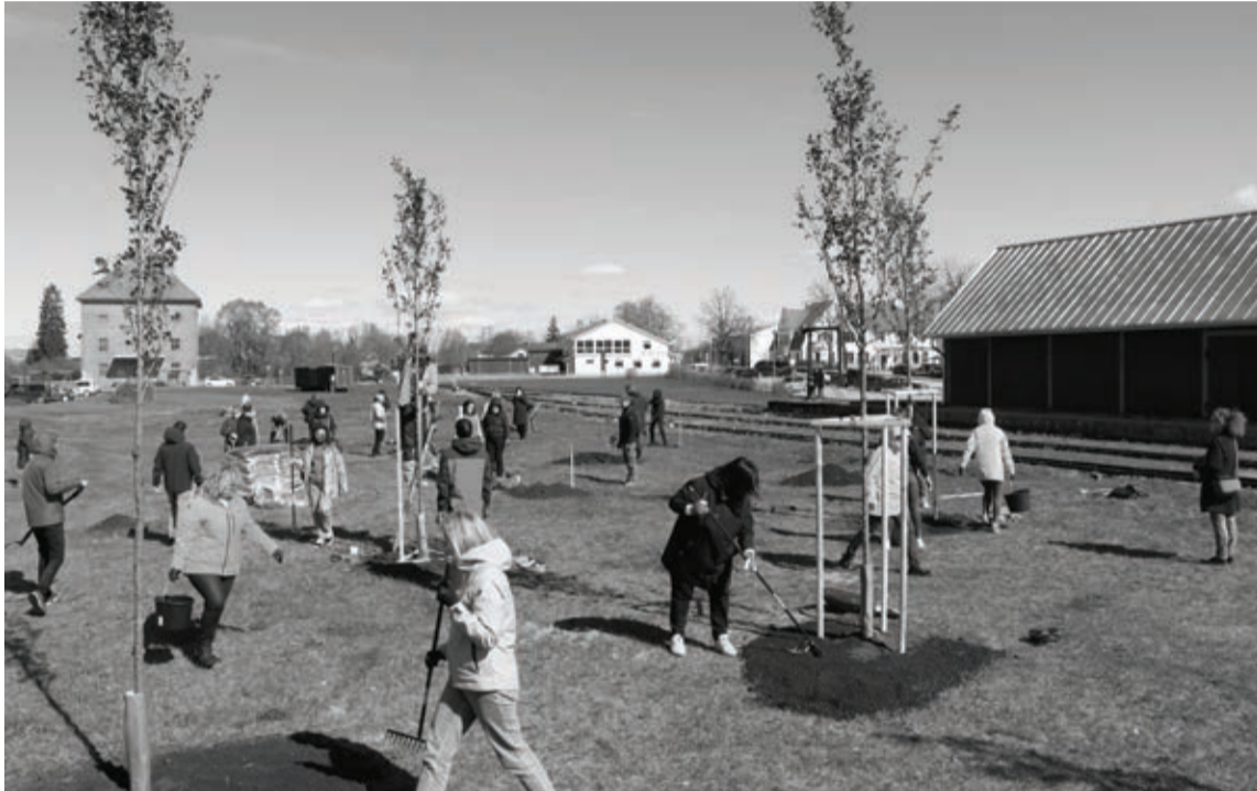
Pie Alūksnes Bānīša stacijas turpmāk augs, kuplos un alūksniešus priecēs sakuru parks, ko pilsētai dāvināja “Alūksnes putnu ferma”