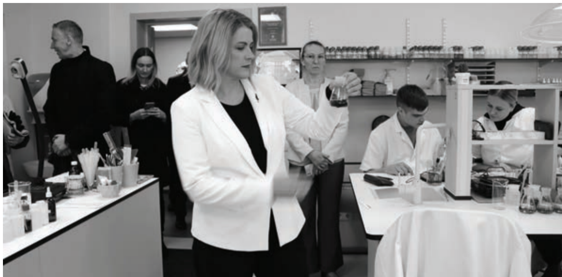
Ministru prezidente Evika Siliņa vizītes laikā viesojās Alūksnes vidusskolā un Ernsta Glika Alūksnes Valsts ģimnāzijā