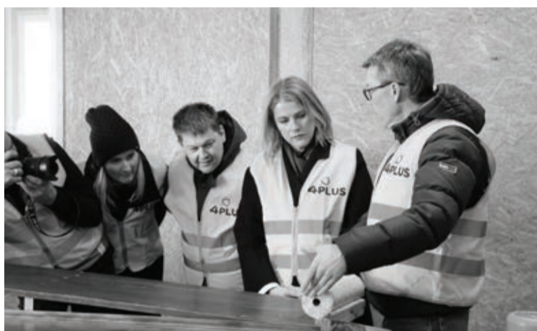
Uzņēmumā "4Plus" iepazīšanās ar ražošanas ciklu un produktiem

Vizītes gaitā Ministru prezidente iepazinās ar mazo un vidējo uzņēmumu darbību novadā. "Biznesa stacijā" viņa apmeklēja vienu no tur strādājošajiem uzņēmumiem - SIA "Impress print", kas nodarbojas ar reklāmas dizaina pakalpojumu sniegšanu. E. Siliņa viesojās arī Alūksnes pilsētas teritorijā esošā kokapstrādes ražotnē