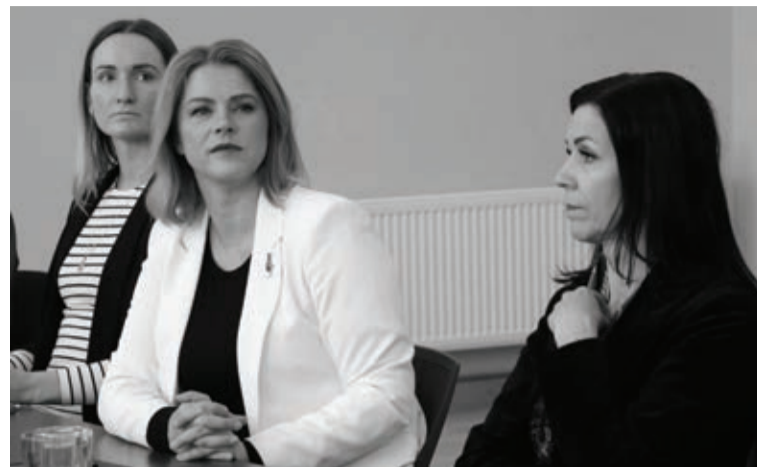
Pašvaldībā uzklausi priekšlikumus par birokrātijas mazināšanu

šaursliežu dzelzceļa vēsturi. Alūksnes novada pašvaldības pārstāvji Ministru prezidentī iepazīstināja ar nozīmīgākajiem pašvaldības paveiktajiem darbiem un istenotajiem