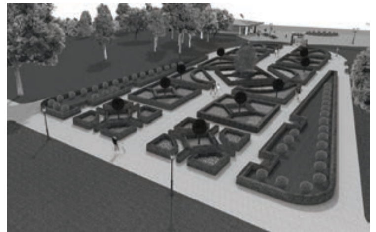
SIA "ARHITEKTA L. ŠMITA DARBNĪCA" veidotā vizualizācija

Darbus paredzēts veikt atbilstoši SIA "ARHITEKTA L. ŠMITA DARBNĪCA" 2020. gadā izstrādātajiem būvprojektiem. Būvdarbus veiks SIA "Smart Energy", būvdarbu izmaksas 208 882,96 EUR, bez PVN. Būvuzraudzību nodrošinās SIA "Marčuks". Būvdarbu izpildes termiņš ir seši mēneši. Projektu vada Alūksnes novada pašvaldības Centrālās administrācijas Attīstības