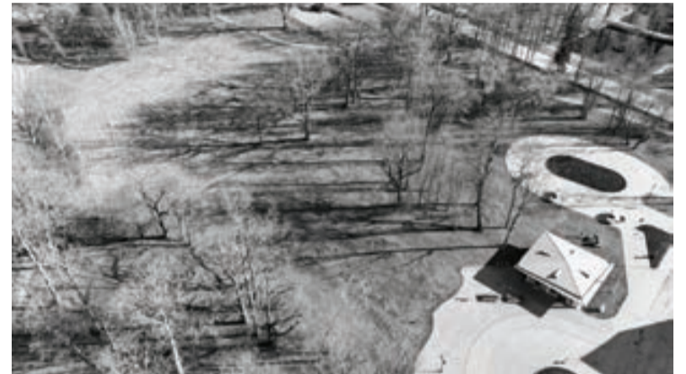
Franču ainavu stila dārzs atradīsies pie vēsturiskās ieejas parkā, Ojāra Vācieša ielā 1, blakus Alūksnes Tūrisma informācija scentrām