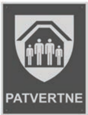
Attēls. Patvertnes zīme

Kopā apsekošanas vismaz 53 ēkas, no tām sešās ēkās telpas atzītas par daļēji atbilstošām patvertnēm izvirzītajām minimālajām tehniskajām prasībām. Uz šīm ēkām ir izvietota zīme "Patvertne" (skatīt attēlu), kas nozīmē, ka pastāvot apdraudējumam – dabas katastrofai vai militārajam uzbrukumam, šī patvertne būs publiski pieejama.