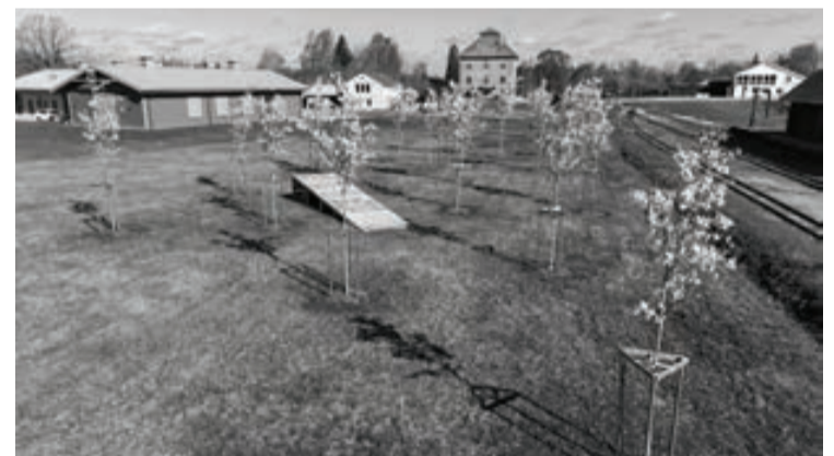
Lai arī kociņi vēl jauni, tie koši zied, tādēļ steidziet baudīt!

Pirms gada – 25. aprīlī, Alūksnes Bāniša stacijas kvartālā tika iestādīts sakuru parks, tā šo teritoriju papildinot ar estētisku un paliekošu akcentu un pavasaros priecējot alūksniešus ar krāšņiem ziediem.