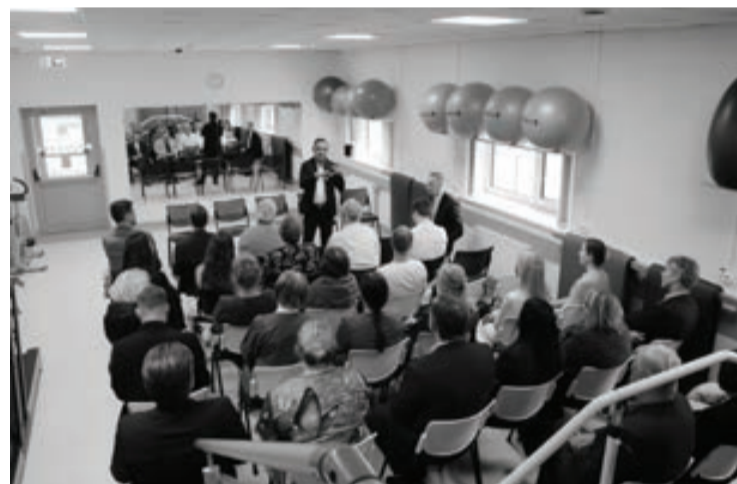
Vizītes laikā veselības ministrs tikās ar Alūksnes slimnīcas darbiniekiem, uzklauso un sniedzot atbildes uz jautājumiem

Alūksnes slimnīca pieder Alūksnes un Smiltenes novadu pašvaldībām. Šobrīd tā ir II līmeņa slimnīca ar 76 gultām, kas nodrošina stacionāros un sekundārās ambulatorās veselības aprūpes pakalpojumus novada un apkārtnē teritorijā iedzīvotājiem. Slimnīcas obligātie medicīniskie profili ir terapija un ķirurģija, kā arī vairāki izvēles profili, tostarp hronisko pacientu aprūpe, ginekoloģija, traumatoloģija un pediatrija. Pēdējos gados slimnīcas attīstībā nozīmīgu ieguldījumu sniegušas Eiropas Savienības fondu un Atveseļošanas fonda investīcijas, kas ļāvušas modernizēt medicīnisko aprīkojumu, kā arī