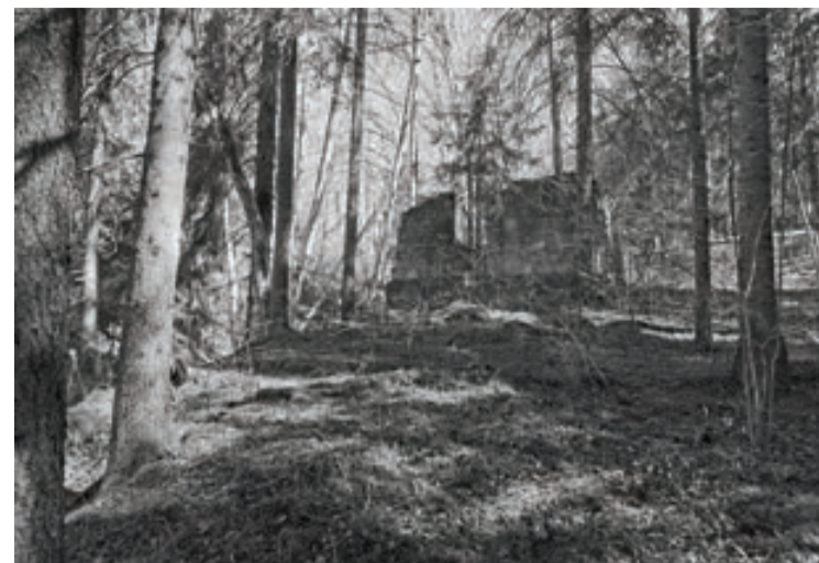
Jaunlaicenes muižas muzeja ekspedīcijā "Dzirnavas senajā Opekalna draudzes teritorijā" apsekota arī Jasu dzirnavu vieta

Šovasar, 19. jūlijā, Zeltiņu Evanģēliski luteriskajā baznīcā atklās Viktora Ķirpa Ates muzeja "Vidzemes lauku sēta" ceļojošo izstādi "Zeltiņu baznīcai 200". Pētījumu par Zeltiņu baznīcas vēsturi laiku griežos un nozīmīgumu vietējā