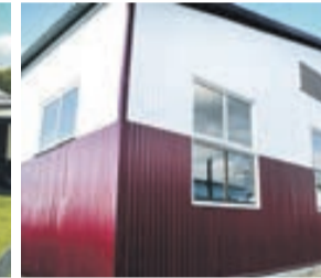
IZMANTOTS NEATBILSTOŠS APDARES MATERIĀLS - TRAPECEVEIDA METĀLA PROFILS