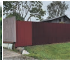
NEATBILSTOŠS MATERIĀLS, NAV 30% CAURREDZAMĪBA