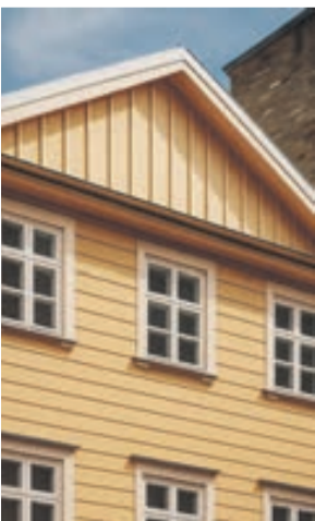
IEVĒROTS LOGU DALĪJUMS UN PROPORCIJAS VISAI ĒKAI

✓ ATBILSTOŠS RISINĀJUMS ✗ NEATBILSTOŠS RISINĀJUMS ✗ NEATBILSTOŠS RISINĀJUMS