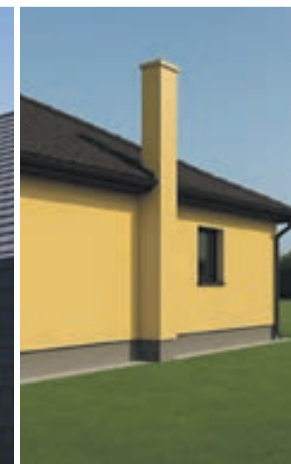
SKURSTENIS INTEGRĒTS FASĀDES APDARĒ