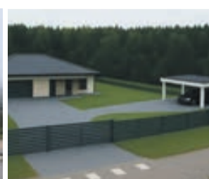
PALĪGĒKA NOVĪETOTA PRIEKŠPAGALMĀ