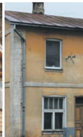
NAV IEVĒROTS VIENOTS LOGU DALĪJUMS UN PROPORCIJAS VISAI ĒKAI