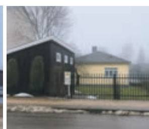
PALĪGĒKA NOVĪETOTA PRIEKŠPAGALMĀ