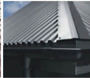
IZMANTOTS NEATBILSTOŠS METĀLA JUMTA SEGUMA PROFILS – TRAPECEVEIDA PROFILS