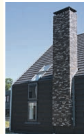
IZMANTOTA ATĻAUTĀ SKURSTENĀ KĪEĢĻU APDARE

✓ ATBILSTOŠS RISINĀJUMS ✓ ATBILSTOŠS RISINĀJUMS ✗ NEATBILSTOŠS RISINĀJUMS