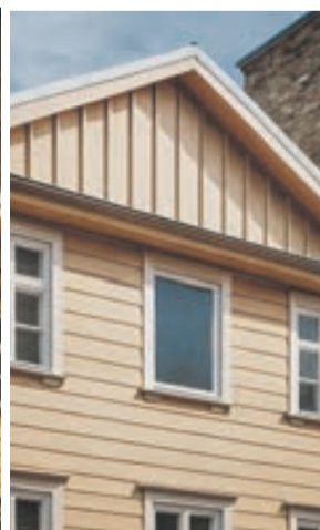
ESOŠAIS LOGS AR DALĪJUMU AIZSTĀTS AR VIENLAIDU LOGA IESTIKLOJUMU BEZ DALĪJUMA