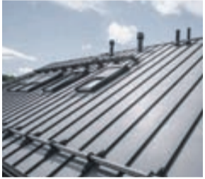
IZMANTOTS ATĻAUTAIS METĀLA JUMTA SEGUMA PROFILS – VALCPROFILS

✓ ATBILSTOŠS RISINĀJUMS ✗ NEATBILSTOŠS RISINĀJUMS ✗ NEATBILSTOŠS RISINĀJUMS