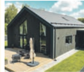
IZMANTOTS ATBILSTOŠS FASĀDES APDARES MATERIĀLS – KOKS

✓ ATBILSTOŠS RISINĀJUMS ✗ NEATBILSTOŠS RISINĀJUMS ✗ NEATBILSTOŠS RISINĀJUMS