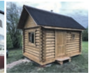
NEAPŠŪTA APAĻKOKA GUĻBŪVE