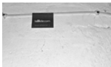
Pielikums Nr. 1: Marķējuma paraugs