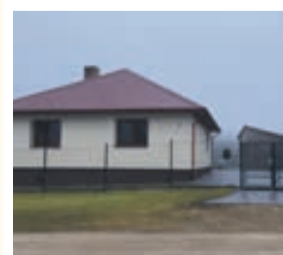
PALĪGĒKA NOVĪETOTA ZEMESGABALA DZIĻUMĀ