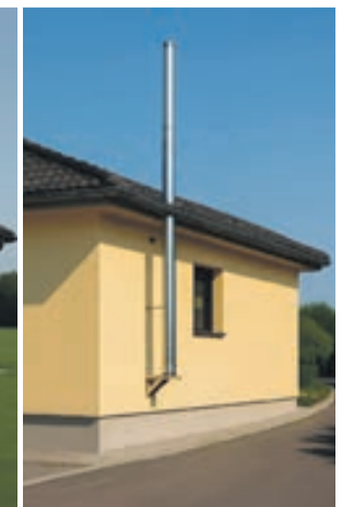
FASĀDĒ IZBŪVĒTS METĀLA SKURSTENIS BEZ APDARES