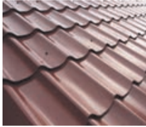
IZMANTOTS NEATBILSTOŠS METĀLA JUMTA SEGUMA PROFILS – METĀLA DAKSTIŅU IMITĀCIJA