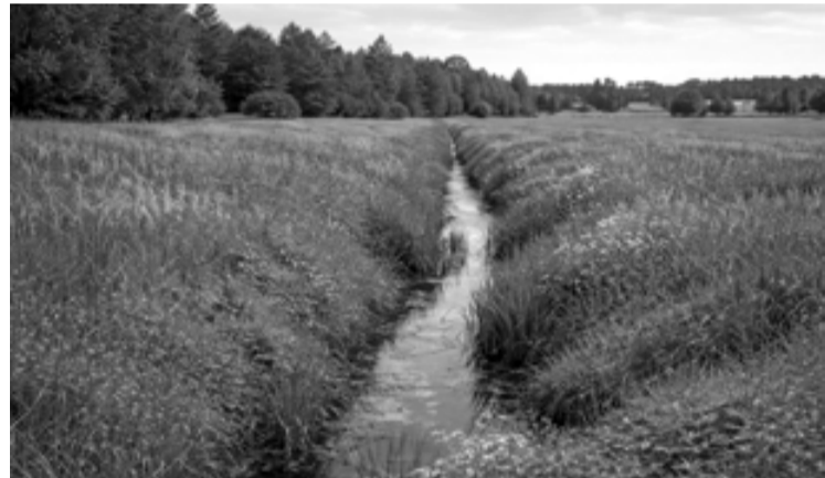
Mākslīgā intelekta radīts attēls