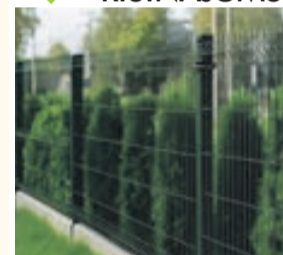
STIEPLU ŽOGS, DZĪVŽOGS