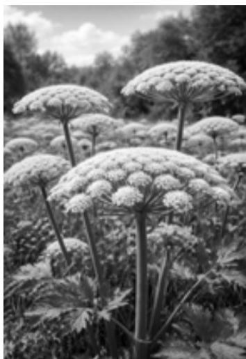
Mākslīgā intelekta radīts attēls

Iepriekšējā pārskata periodā pašvaldības policija sastādījusi 42 administratīvo pārkāpumu protokolus par platībām, kurās