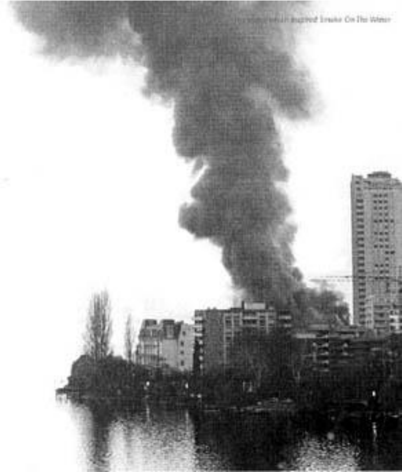
1997: A major fire in London on the River