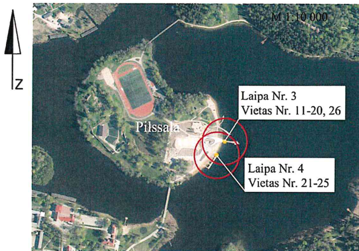
Piestātņu vietas uz laipas Nr. 3