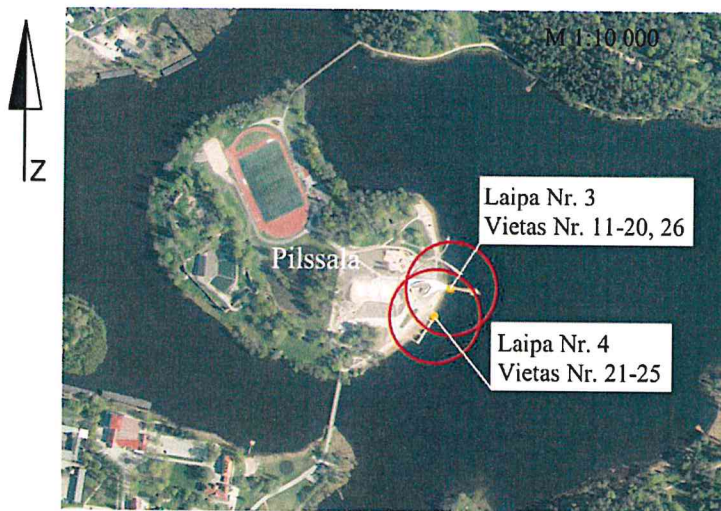
Piestātņu vietas uz laipas Nr. 3