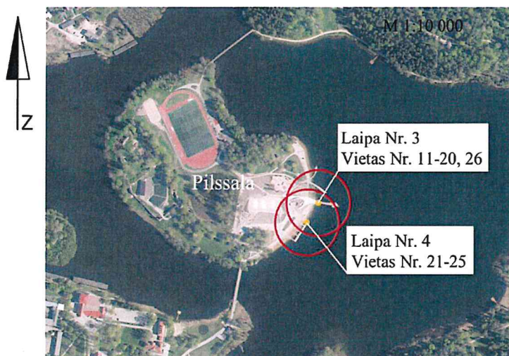
Piestātņu vietas uz laipas Nr. 3