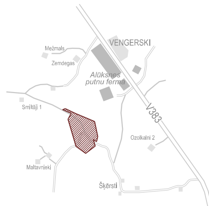
TERITORIJAS ATRAŠANĀS VIETA